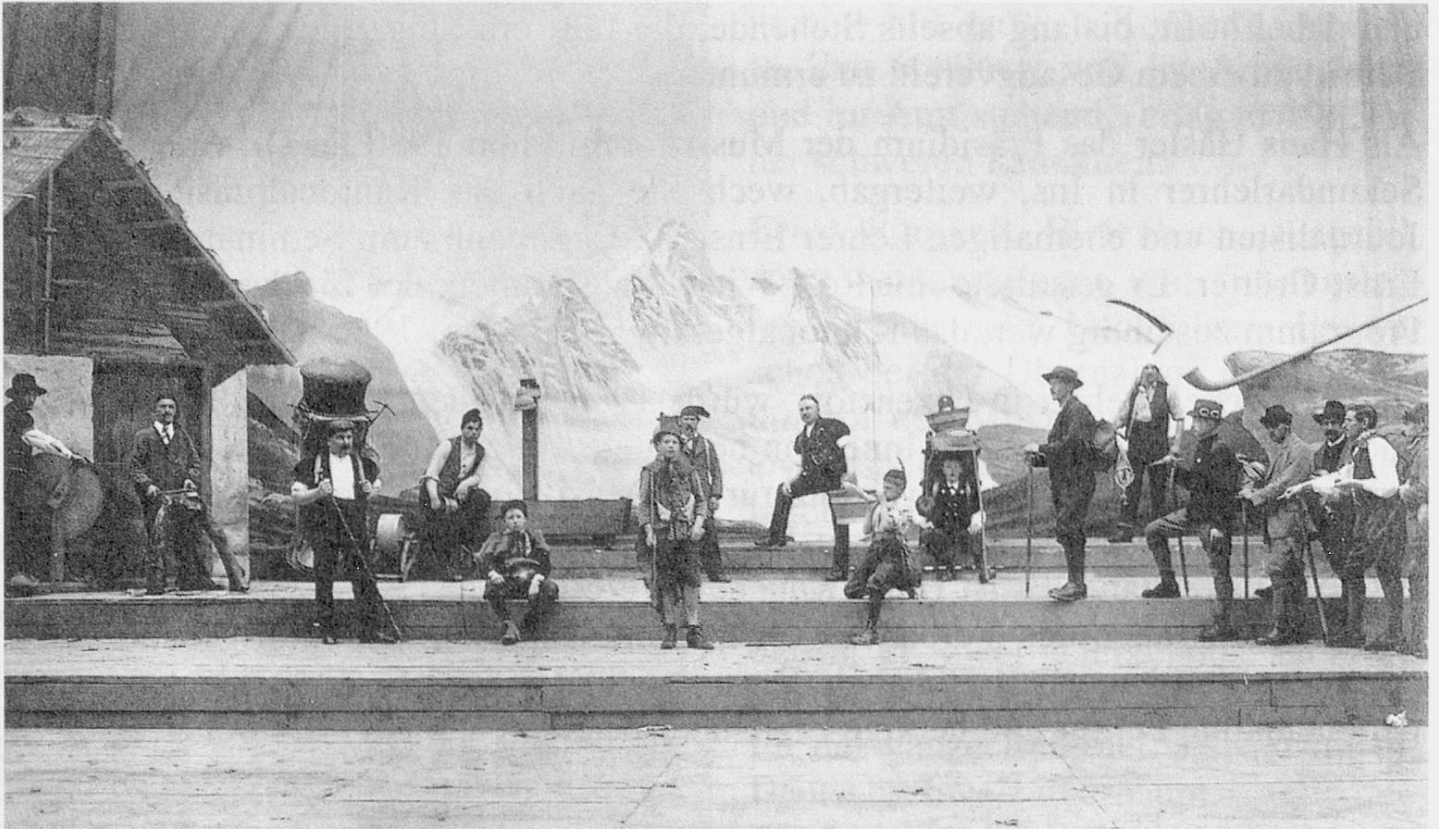
Festspiel am Kantonalgesangfest 1926 in Interlaken