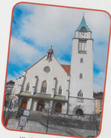
Kirche St. Maria Biel