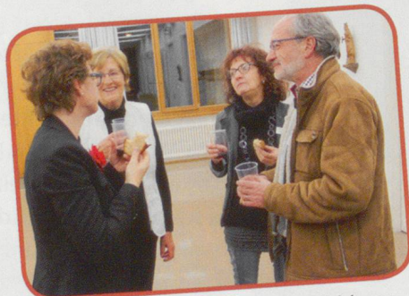
Ein verdienter Schluck zum Schluss