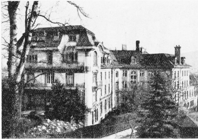
Der Lindenhof in Bern

Voraussicht, dass dieser Verband in der Nachkriegszeit eine wichtige Aufgabe innerhalb des Weltbundes zu erfüllen haben werde, liess der Leitung des «Nationalverbandes» und auch uns eine Fusion mit dem «Schweiz. Krankenpflegebund» als wünschenswert erscheinen. Wir begrüsst deshalb die Fühlungnahme der beiden Verbände anlässlich dieser Berner Tagung und stellten uns zur Mitarbeit an einer Neuorganisation zur Verfügung. Dank der Mithilfe der Vertreter des Schweiz. Roten Kreuzes wurde schon am 3. Dezember 1944 in einer ausserordentlichen Delegiertenversammlung der «Schweiz. Verband diplomierter Krankenschwestern und Krankenpfleger» (SVDK) durch die Fusion des Krankenpflegebundes mit dem Nationalverband zur Tatsache. Es war uns eine grosse Genugtuung, dass zu dessen Präsidentin eine der Unsern, unsere Vertreterin im Comité des «Nationalverbandes», gewählt wurde. Dass diese Wahl eine glückliche war, hat sich in der Folge reichlich erwiesen und das Ansehen, das unser SVDK heute schon innerhalb des Weltbundes geniesst, hat wohl auch unserer Voraussicht recht gegeben.