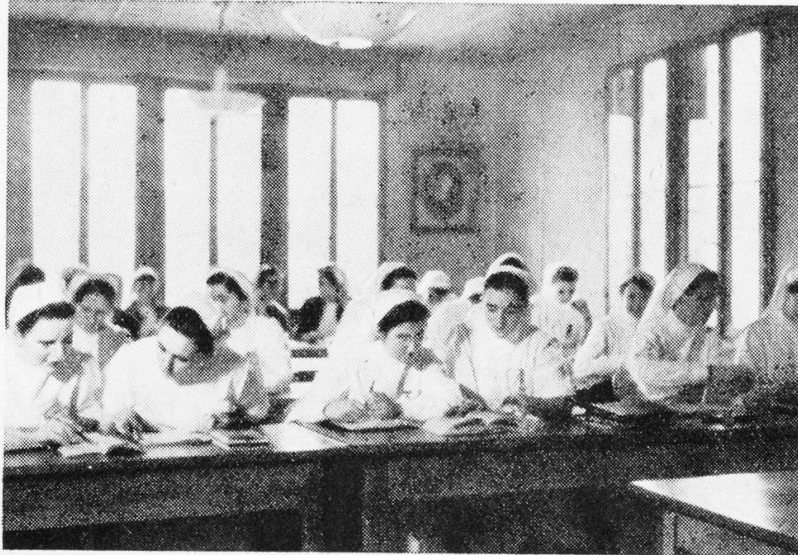
Im Schulzimmer der Rotkreuzpflegerinnenschule Lindenhof Bern

ihrem Umkreis lebenden Schwestern um sich, diskutieren mit ihnen die «Fragen der Schule und der Schwesternsache» und natürlich auch persönliche Probleme, bieten ihnen Anregung für Geist und Gemüt und stellen so den Kontakt zwischen ihnen und mit ihnen her. Die Gruppenleiterinnen selbst sind in Verbindung mit der Präsidentin und durch diese wiederum mit der Schule. Sie versammeln sich einmal im Jahr zu gegenseitigem Austausch. Der Schwesternmangel und die Ueberbeanspruchung jeder einzelnen lassen zwar unsere Zusammenkünfte manchen als überflüssig erscheinen, aber es hat sich doch schon da und dort die Einsicht durchgesetzt, dass wir nur gemeinsam zum Ziele kommen. Jedenfalls erfordert das Amt der Gruppenleiterin sehr viel Geduld und Ausdauer.