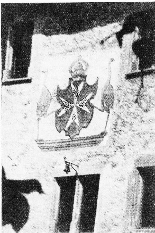
L'écusson de l'ordre de Saint Jean de Malte à son ancien hospice de Bubikon, canton de Zurich (Suisse)