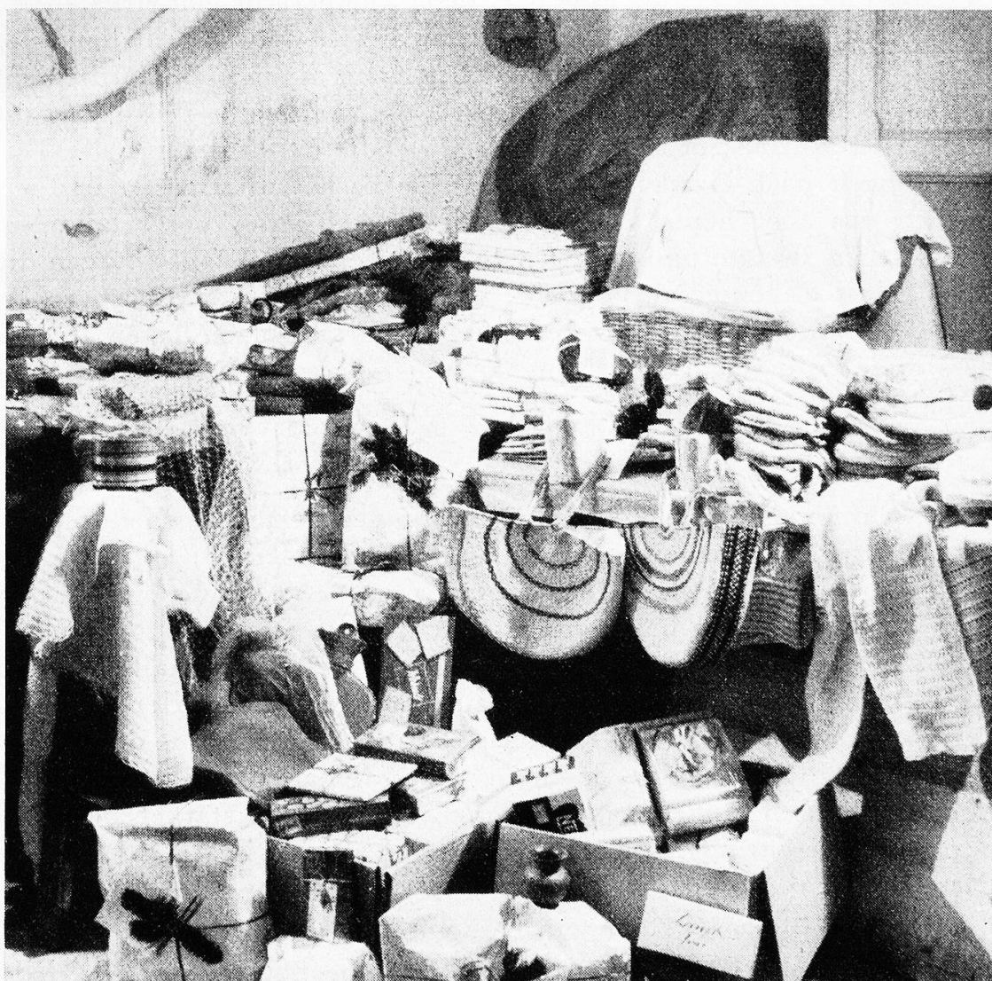
Entraide de Noël : une partie des cadeaux. Weihnachtsaktion : ein Teil der Geschenke.