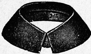
Ecklig und abgerundet