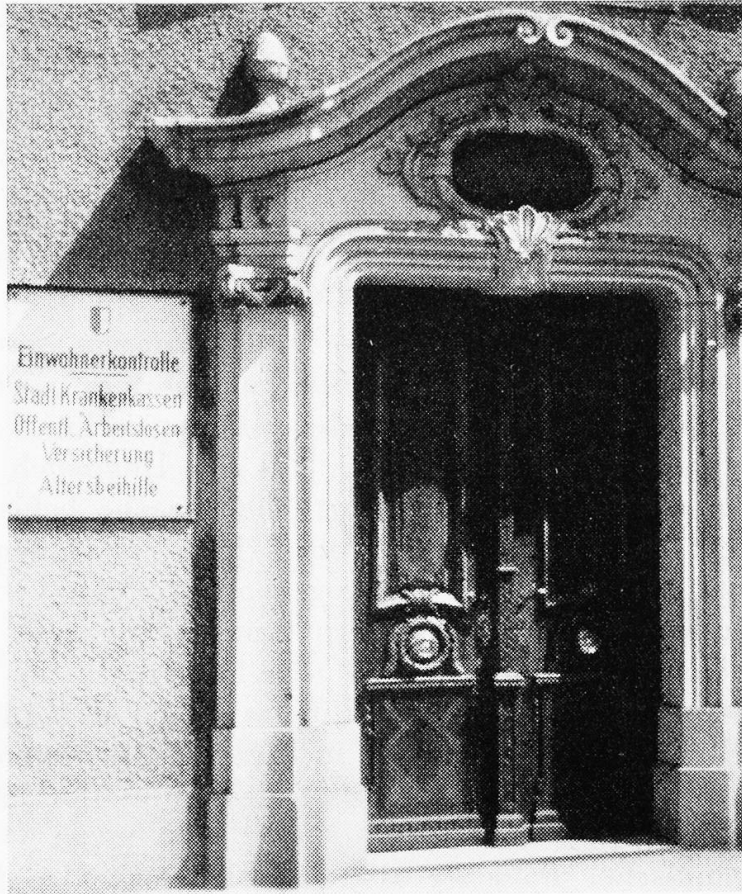
Portal des alten Bürgerspitals in Luzern

In der Kartusche ob der Türe stehen die Worte: