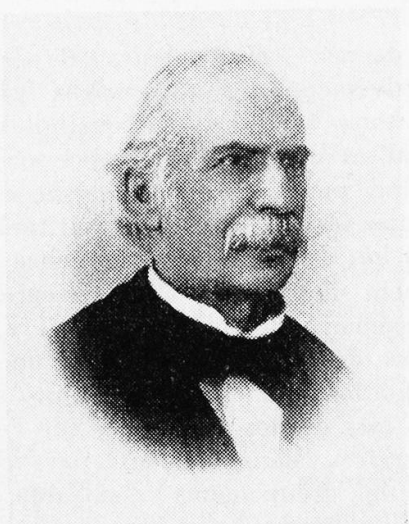
Le Dr Louis Appia vers 1890