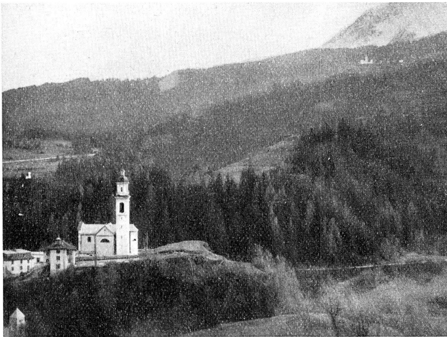
Kirchhügel und Plattas von Norden gesehen.

Gemeindearchives erwähnt sein, daß damals noch Mauern freilagen, die den Dorfbewohnern als Steinbrüche dienten. Heute hat die Natur alles mit Rasen überwachsen lassen. Es ist hier noch ausdrücklich festzustellen, daß auf dem Kirchhügel nie eine Feudalburg gestanden hat, denn es fehlen alle urkundlichen Hinweise vollständig, was bei einer Burg in dieser zentralen Lage im Kreuzungspunkt wichtiger Verkehrswege doch nicht möglich wäre.