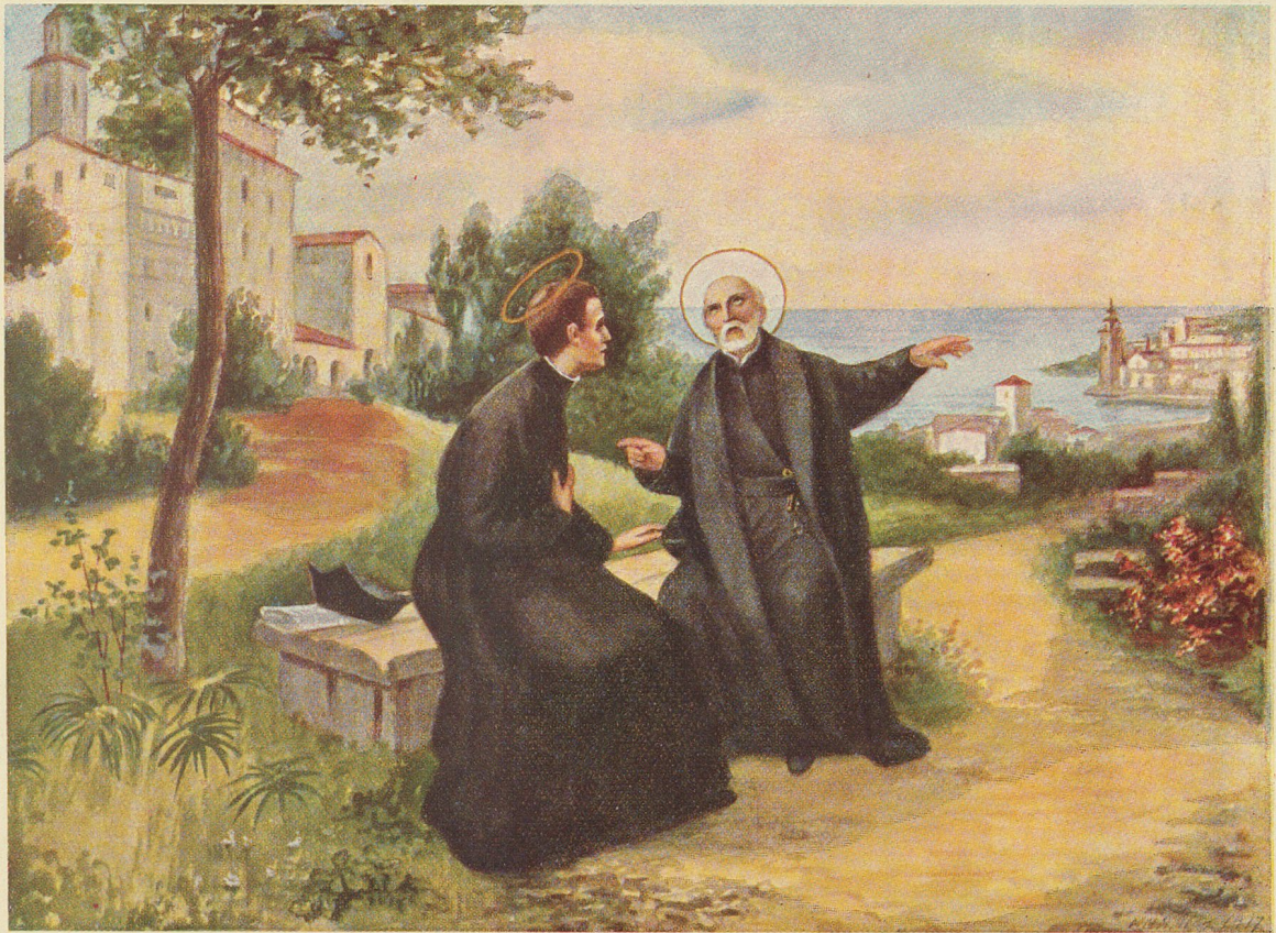
Ein heiliger Lehrmeister und ein heiliger Schüler