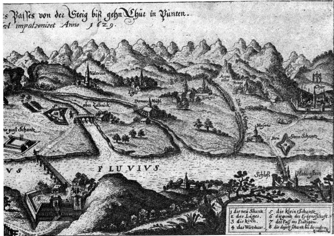
Panorama des Rheintales von Chur bis zur Landquart. Ausschnitt aus einem Kupferstich von 1629