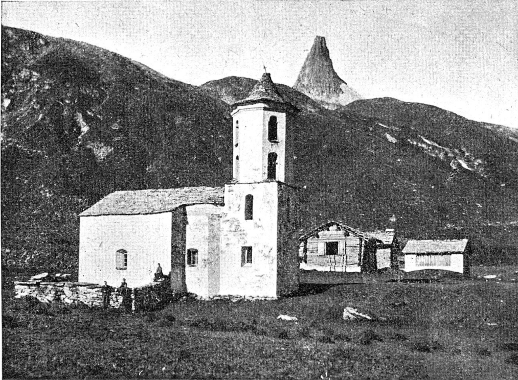
Kirchlein von Zerfreila mit Hellig Garta und Zerfreilahorn

Die hintersten Gebäude des Oberboda sind zwei Ställe, «d Steigäda», die wegen ihrer besondern Bauart auffallen. Sie sind nämlich ganz aus Stein gemauert und erinnern stark an die tessinischen Ställe. Das erscheint als verwunderlich, erklärt sich aber aus der Tatsache, daß in alter Zeit ein namhafter Verkehr zwischen dem Zerfreila- und dem tessinischen Blegnotale bestanden hat. Er führte über den Sorredapaß, der von der Lampertschalp ausgeht und in Olivone mündet. Nach der Überlieferung wurde viel Korn über den weiten und beschwerlichen, stückweise vergletscherten Paß vom Tessin nach Zerfreila gebracht und dort — der Mühlstein bezeugt es — in der Mühle gemahlen. Die zwei Alpen Lenta und Lampertschalp sind heute noch im Besitze tessinischer Gemeinden. Die «Blegner» oder «Plender» befuhren sie früher mit dem eigenen Vieh und hatten in der Lampertschalp ein ganzes Dörfchen an Alphütten -häuschen und Ställen. Sogar eine kleine Kapelle war dabei, die erst in den 1920er Jahren in einem schneereichen Winter zusammenstürzte.