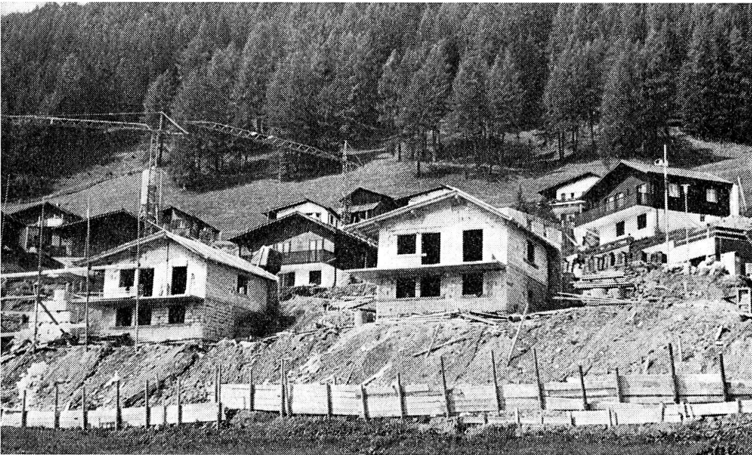
...und was daraus entstehen kann. Gibt es keine gesamtwirtschaftlich sinnvollere Alternative?