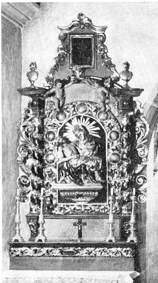
Muttergottes-Seitenaltar in Kuratkapelle Obersaxen-St. Martin, 1747 (?) vermutlich von Placi Schmet geschaffen. Medaillons mit Szenen der Schmerzen Mariae; Pietà modern; restauriert 1930. Foto 1939.