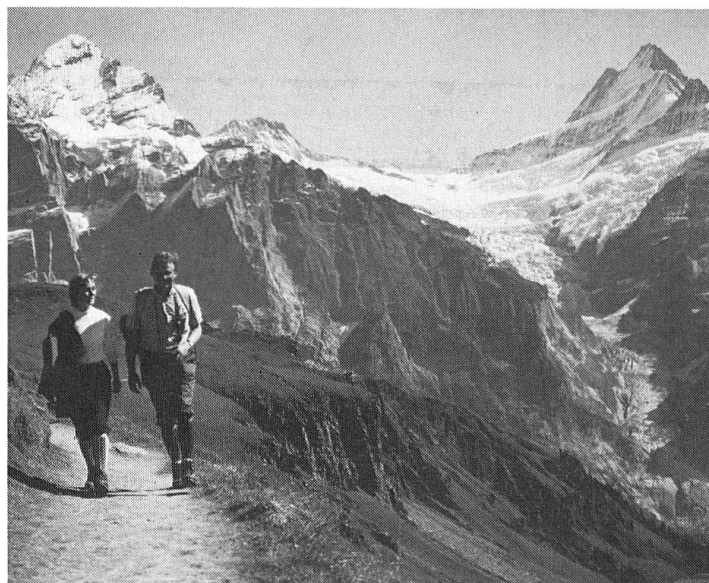
Abb. 2 + 3: Ausschlaggebende Gründe für eine Reise in die Schweiz: Hoher Komfort . . .

. . . reizvolle Landschaft, Entspannung, Gesundheit, Gemütlichkeit.