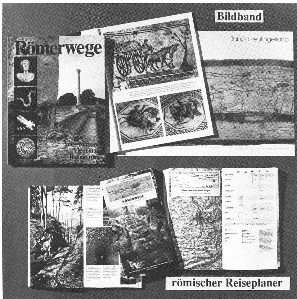
Abb. 4: Publikationen zum Projekt «Römerwege».

Das Kulturthema stellt für uns auch einen wirksamen Anknüpfungspunkt dar, um die Zusammenarbeit mit neuen Partnern zu pflegen und zu versuchen, von den Möglichkeiten des Kultursponsorings zu profitieren. Wir sind sicher, dass unsere Botschaft mit den damit verbundenen Marktbearbeitungsaktivitäten mithilft, das Ansehen unseres Reise- und Ferienlandes ganz allgemein zu heben und es als noch lohnenderes Ziel zu profilieren.