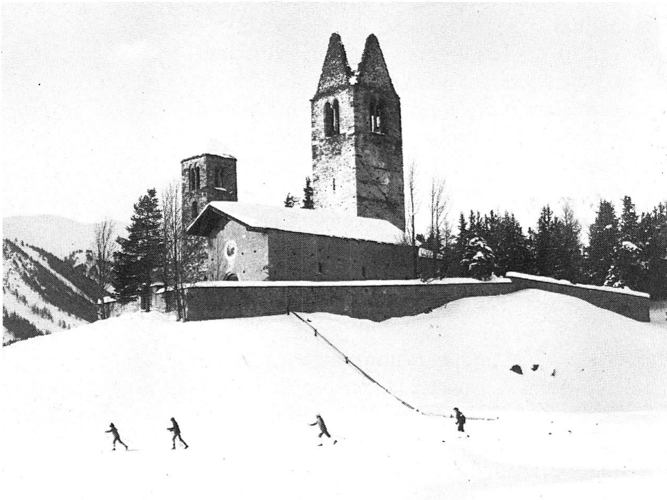
Abb. 1: Wegen Vandalismus und fehlendem Respekt der Besucher kann die Kirche San Gian bei Celerina nur noch zu festgelegten Zeiten und unter Aufsicht besichtigt werden.

In diesem Zusammenhang stellt sich ganz besonders das Problem der Bewahrung der kulturellen Vielfalt und ihrer Koexistenz mit einem wachsenden Gästestrom. Es wäre indessen falsch, den Tourismus generell als potentiellen effektiven Störer oder gar Zerstörer der Kultur zu qualifizieren. Chancen und Risiken werden sich nach Massgabe des Gästeverhaltens entwickeln. Der sogenannte Massentourismus zeigt seine Auswirkungen nicht a priori als Funktion der grossen Zahl auf beschränktem Raum, sondern in der Summe des Verhaltens der Gäste. Eine kleine Zahl von «unkultivierten», konsumgierigen Touristen hinterlässt grössere Schäden als eine grosse Zahl von Besuchern mit respektvoller Annäherung an das Gastland mit seiner Natur und Kultur. Der Reiseschriftsteller Erich Ellwein hat diesen Anspruch vor vielen Jahren schon in das Postulat von der «Liebe zur Andersheit der Andern» gefasst. So werden Schutzmassnahmen für sich allein kaum zum Ziel führen, wenn nicht gleichzeitig der internationale