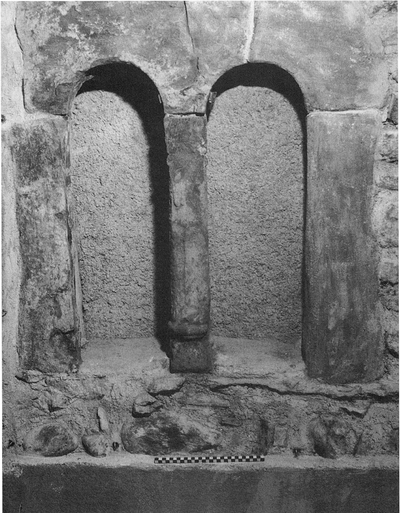
Chur 1990, Rabengasse 3–7; Doppelrundbogenfenster an der Nordfassade des Hauses Nr. 5. Um 1200. Das rechte Gewände wurde erst im letzten Jahrhundert durch Ziegelmauerwerk ersetzt.