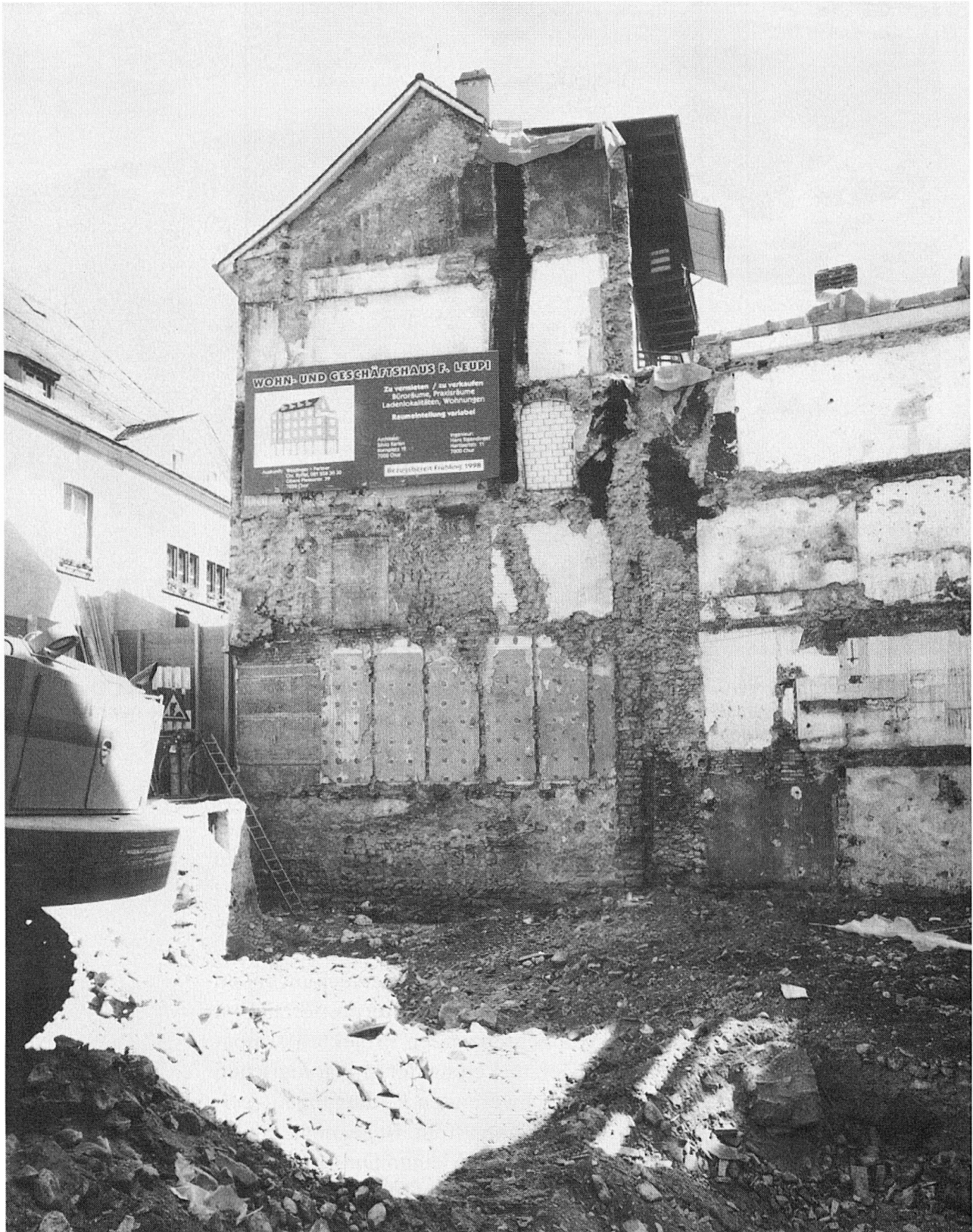
Nach dem vollständigen Abbruch des Hauses Poststrasse 30 im vergangenen Juni wurde dieser Blick an die Nordfassade des Nachbarhauses frei. Dabei konnte hochmittelalterliches Mauerwerk bis in die Höhe unterhalb der Reklametafel beobachtet werden.