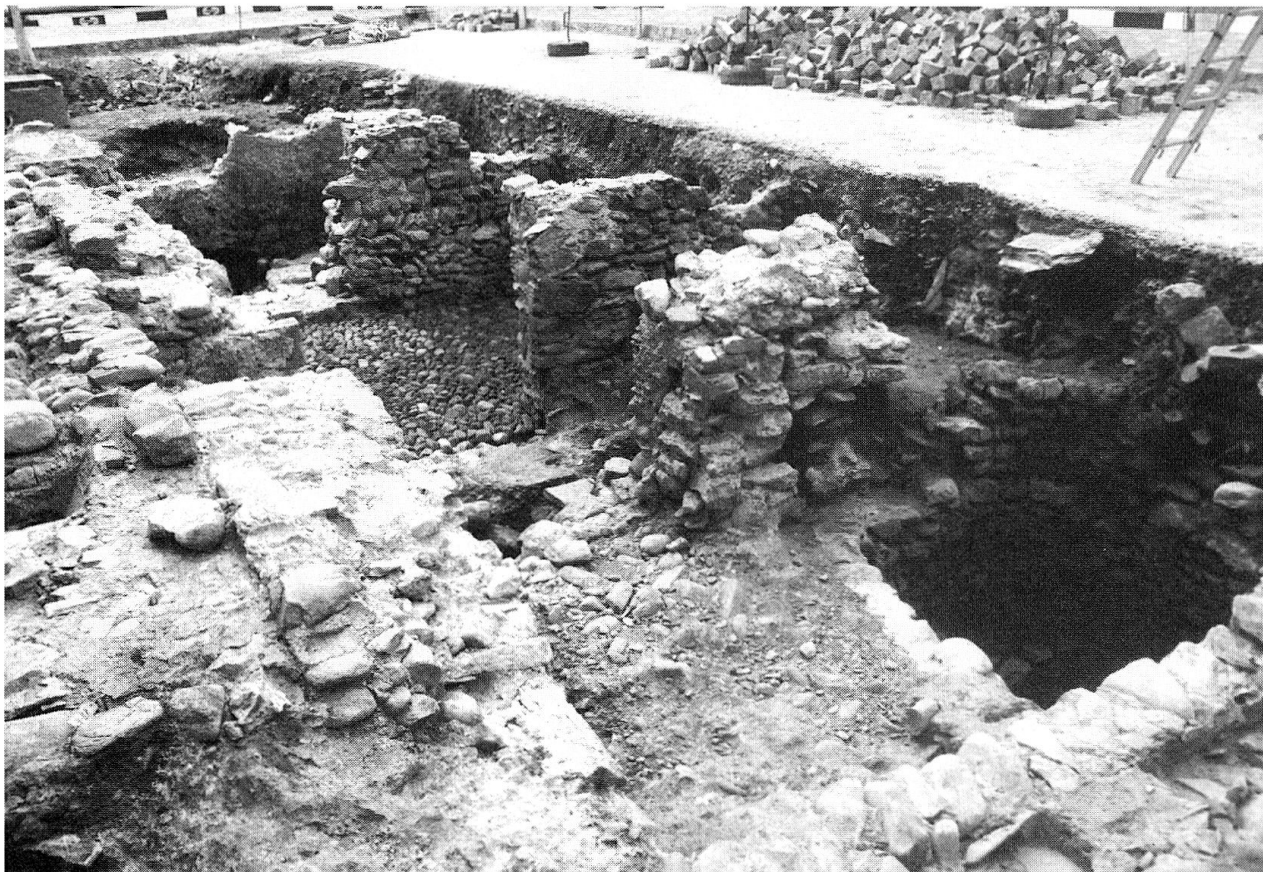
Diese Kellermauern wurden 1995 im Westbereich des Churer Martinsplatzes freigelegt. Das dazugehörige Haus, dessen Ursprünge bis in die Jahrtausendwende zurückgehen, wurde nach dem Stadtbrand 1574 zugunsten einer grösseren Platzfläche abgebrochen.

übergreifende Zusammenhänge herzustellen und, im Falle einer Gebäudeuntersuchung eines einzelnen Hauses, wichtige Ergänzungen zum äusseren Bereich liefern. Auch hier sind es wieder die Spuren der Stadtbrände, welche die – auf engstem Raum – in Schichten gepresste Stadtgeschichte gliedern.