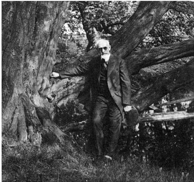
Paul Juon in Vevey