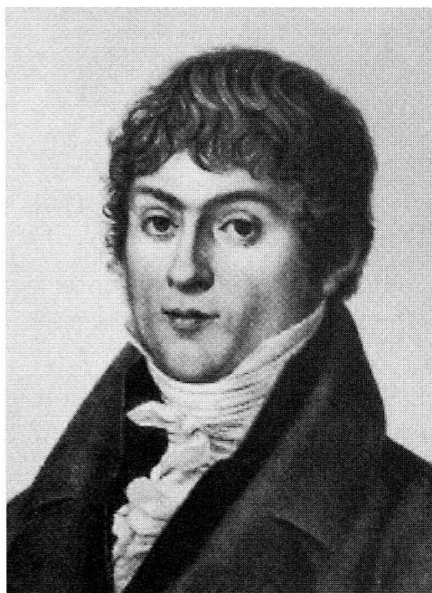
Während fünf Jahren war Johann Caspar von Orelli (1787–1849) an der Bündner Kantonsschule als Lehrer für Französisch und Italienisch, Griechisch, Deutsch und Geschichte tätig.