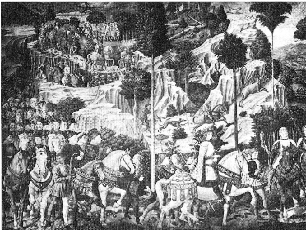
Abb. 1: Benozzo Gozzoli, Reise der Heiligen Drei Könige

Bis in die Mitte des 15. Jahrhunderts werden die Berge in der Malerei nur in Form von Hieroglyphen dargestellt. Bei Benozzo Gozzoli (1420–1497) wirkt die Naturdarstellung stilisiert ohne Beachtung der tatsächlichen Grössenverhältnisse, z. B. auf seinem Bild «Reise der Heiligen Drei Könige» (Abb. 1).