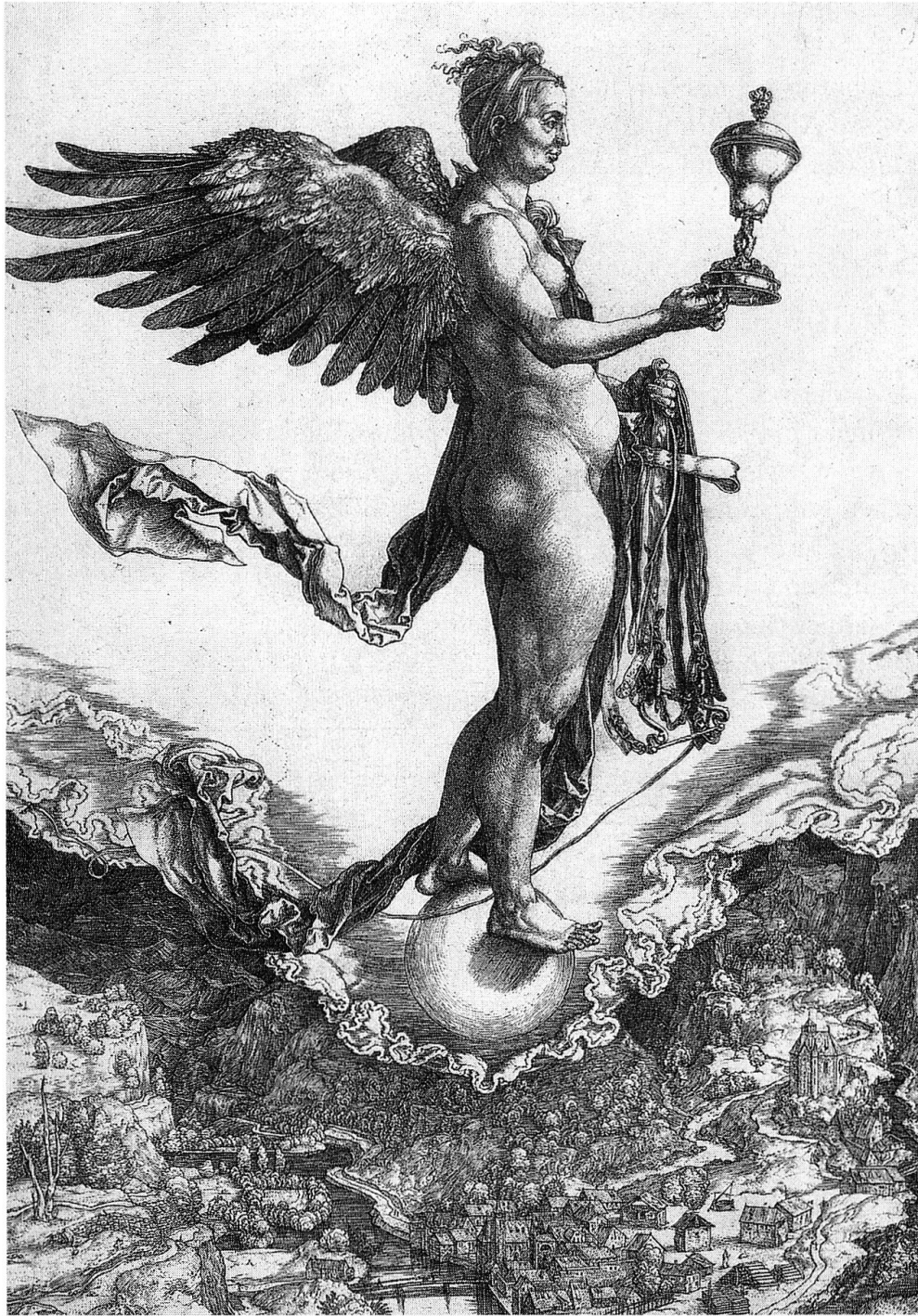
Abb. 3: Albrecht Dürer, Das Grosse Glück

birgsthematik in der europäischen Malerei des 17. Jahrhunderts und damit die Geburt der Alpenmalerei im 18. Jahrhundert entscheidend gefördert.