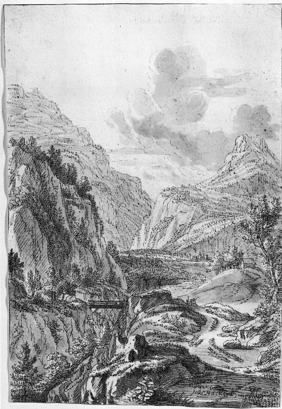
Abb. 4 Jan Hackaert: Viamala Feder in Braun und Pinsel in Grau, laviert, 37,5×29,3 cm, Kunsthau Zürich

grund ist der Weg zu erkennen, welcher nach einer Biegung hinter einem Felsblock über eine Brücke führt. Darauf sind die Gestalten dreier Wanderer zu erkennen.