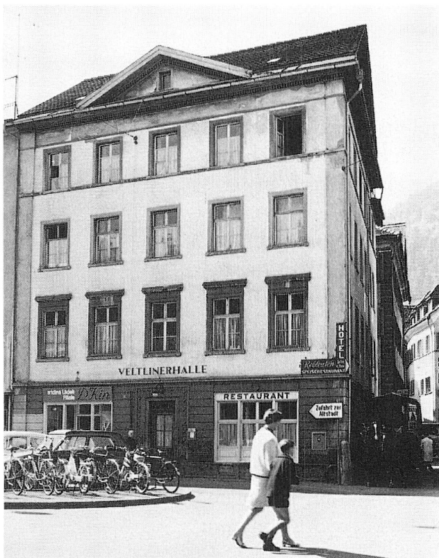
Abb. 3 unten rechts: Kornplatz Nr. 11, heutige Aufnahme. (Foto DPG).