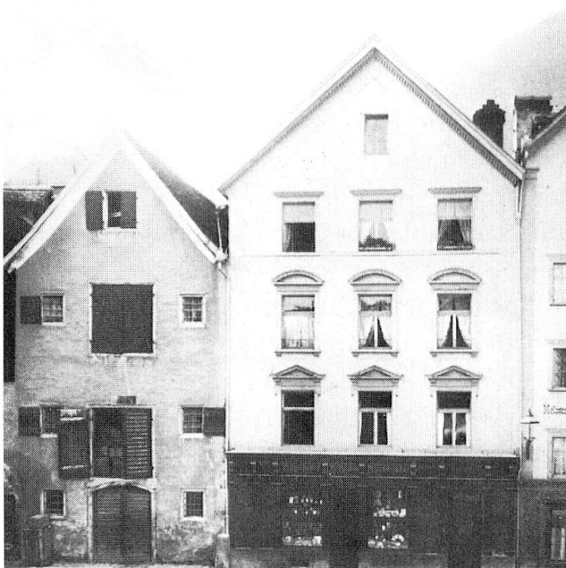
Abb. 7 unten rechts: Kornplatz 1 und 3, heutige Aufnahme. (Foto DPG).

Abb. 6 unten links: Kornplatz Nr. 1 und 3, historische Aufnahme aus: Peter Metz/Heinrich Jecklin, Chur einst und heute, Chur 1982, S. 114 unten).