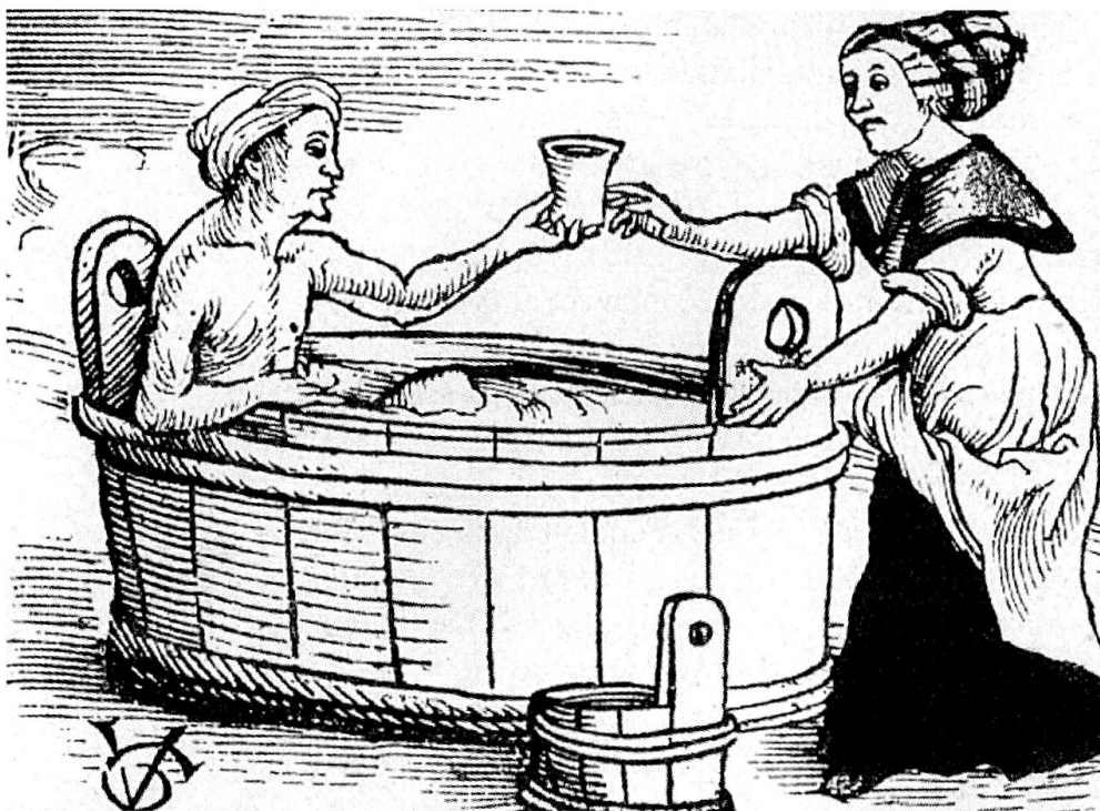
Wasserbad. Holzschnitt von Urs Graf aus: Kalender Doctor Kung (Kungsberger). Zürich, Hans am Wasen, 1508.

für die Gäste die Möglichkeit, das Badgeld in Form von Wein oder Most zu bezahlen, denn Geld als Zahlungsmittel war in ländlichen Gebieten knapp.