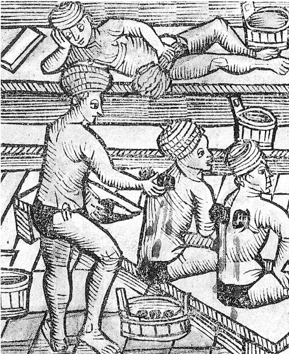
Das Schröpfen. Kolorierter Holzschnitt aus einer böhmischen medizinischen Handschrift, um 1500, Státní Kin- hovna Praha.