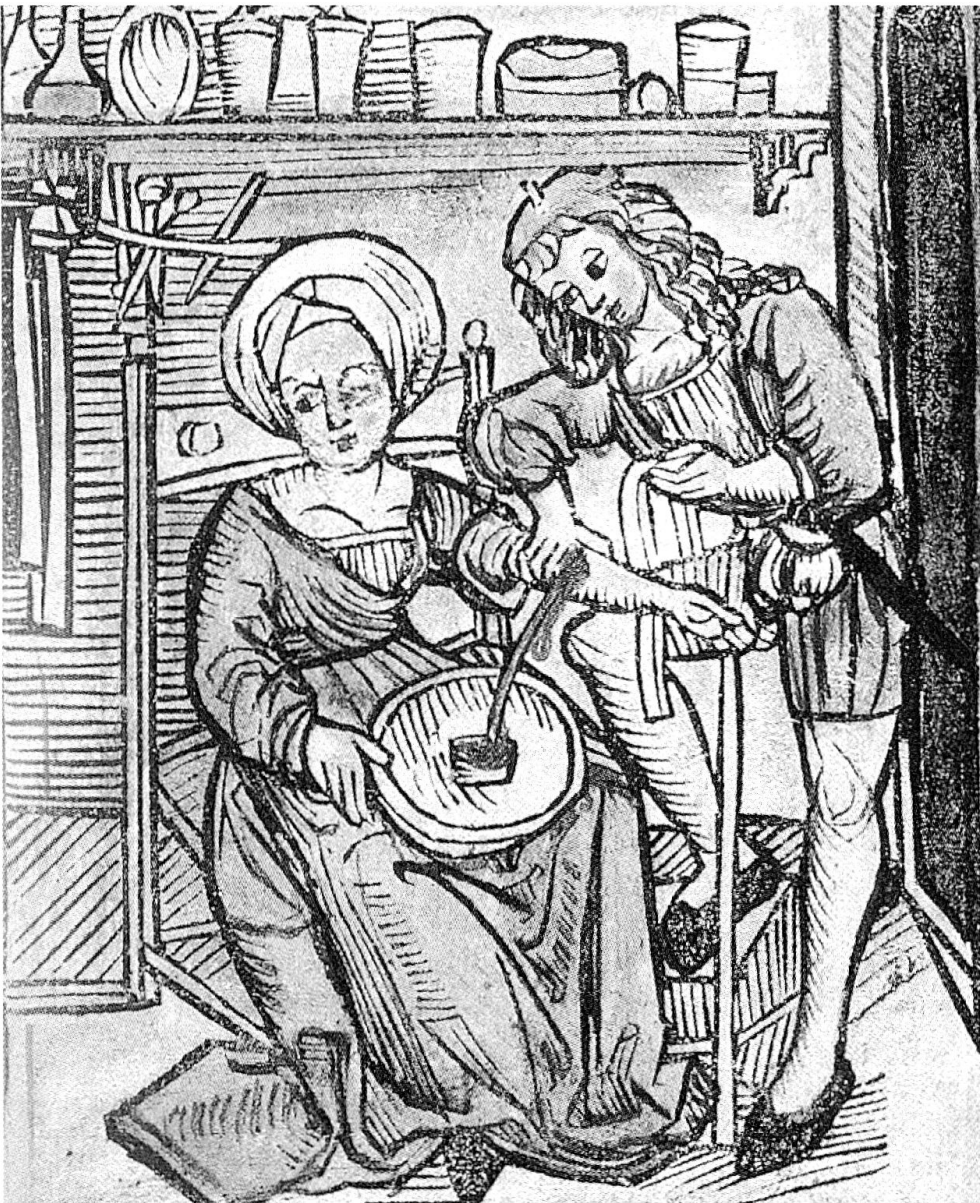
Der Aderlass. Kolorierter Holzschnitt aus einer böhmischen medizinischen Handschrift, um 1500.

wirkungen Beispiele genannt werden. So hatte der Verfasser für die Heilung von Podagra, einer Art von Gicht, oder auch für Folgen eines schweren Kindbetts, offenbar noch keine Beispiele zur Hand. Hingegen wurden für folgende Krankheiten Geheilte aufgeführt: