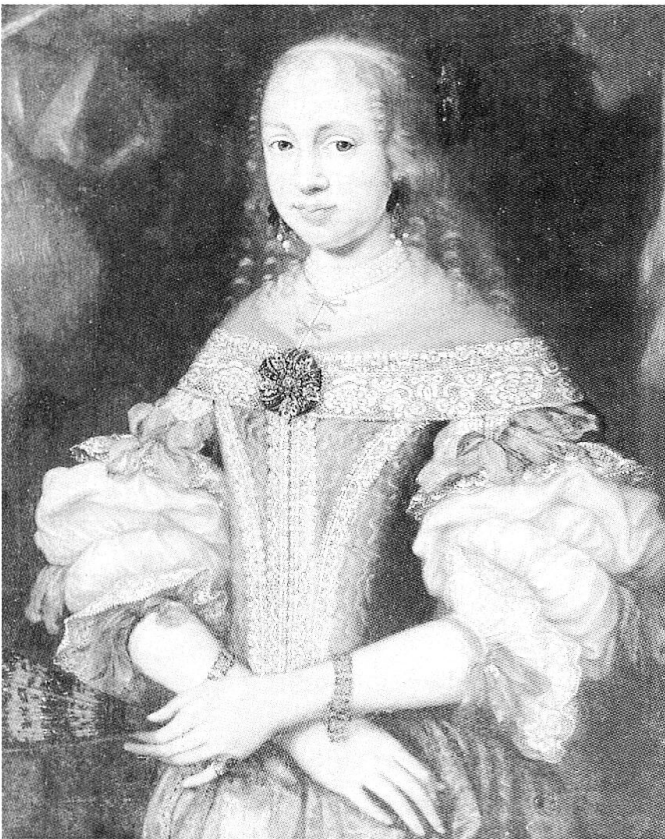
Hortensia Gugelberg von Moos, geborene Salis (1659–1715). (Bild: Handbuch der Bündner Geschichte, Bd. 3: Frühe Neuzeit, hg. v. Verein f. Bündner Kulturforschung, Chur 2000, S.121.)

Auch Joh. Jacob Scheuchzer betont die angenehmen Umstände eines Besuchs des Fläscher Bades: nebst denen Ordinari-Wirkungen des Wassers wohl dienet der gesunde Fläscher-Luft, der edle Fläscher Wein, der schöne Prospect, die angenähmen Spatziergänge, gute Gesellschaft und andere dergleichen Gemüth-erfreuende Ding, die man nicht leicht anderstwo in compendio beysamen findet [...]. 27