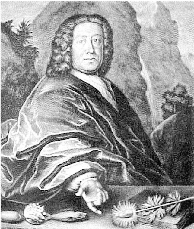
Johann Jakob Scheuchzer (1672–1733). Porträt von J. Heidegger, 1731.

Als Mineralien werden zwei Arten terra sigillata (nach zeitgenössischem Lexikon 16 : Siegelerde, fetter, schwerer Ton) und Salpeter genannt. In der zweiten Auflage des Prospekts, 1669 in Bregenz gedruckt, wurden die Kapitel über die Zusammensetzung und Wirkung des Wassers überarbeitet. Auf der einen Seite wurde der Text gerafft, so dass unter anderem die oben zitierte Feststellung weggelassen wurde. Auf der anderen Seite wurden nun aber neue Mineralien und Metalle, Schwefel und Stahl, aufgezählt. 17 Beim Schwefel musste allerdings angemerkt werden, dass er durch Riechen nicht erkannt werden konnte. Schwefel galt damals als Qualitätsmerkmal für ein Heilbad und wurde wohl deshalb angeführt. Stahl war eine gängige Arznei und wurde nicht so streng von Eisen getrennt wie heute. So bezeichnete man Bäder mit eisenhaltigem Wasser, wie beispielsweise das Bad Pyrmont, als Stahlbrunnen. 18