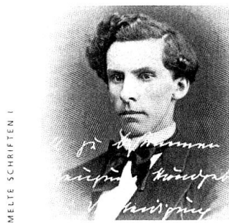
Generalstabschef Theophil Sprecher von Bernegg