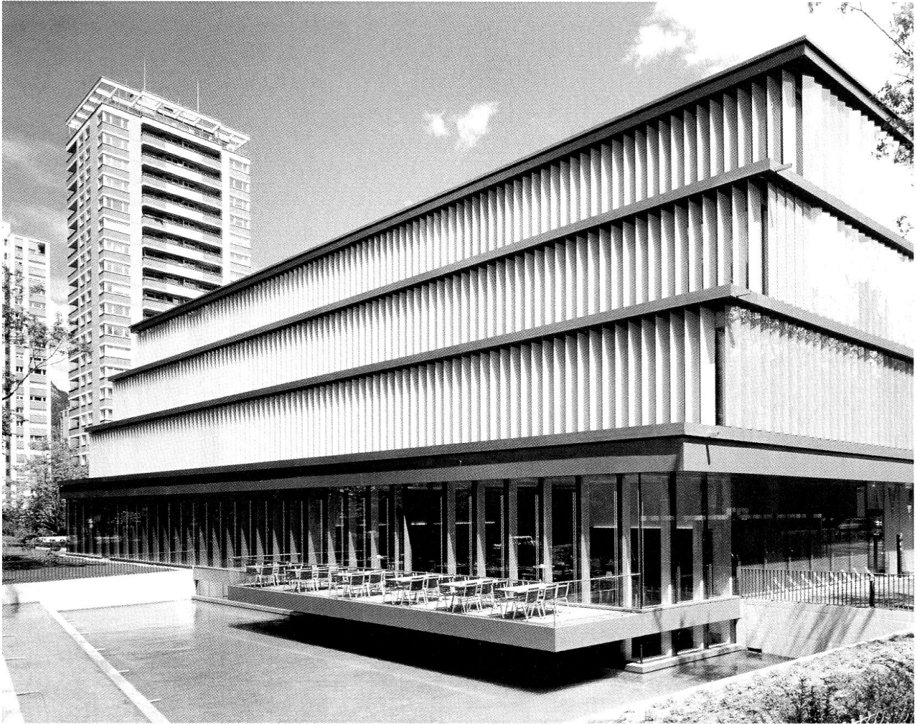
Der hintere Bereich des Würthgebäudes besitzt durch die Abtreppung des Volumens und einer über einer Wasserfläche sich befindenden Terrasse eine Art Gartensituation.

risches Element, da das Rot nur je nach Standpunkt hinter den Sonnenblenden sichtbar ist.