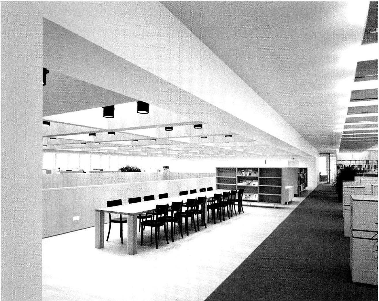
Gemeinschaftliche Zone mit der Bibliothek im Hintergrund auf der obersten Etage der Büroflächen.

aus geöltem Eichenholz, wodurch dieser zentrale Bereich bildlich zu einem begehbaren Möbel wird und räumlich eine konzentrierte Ruhe erhält.