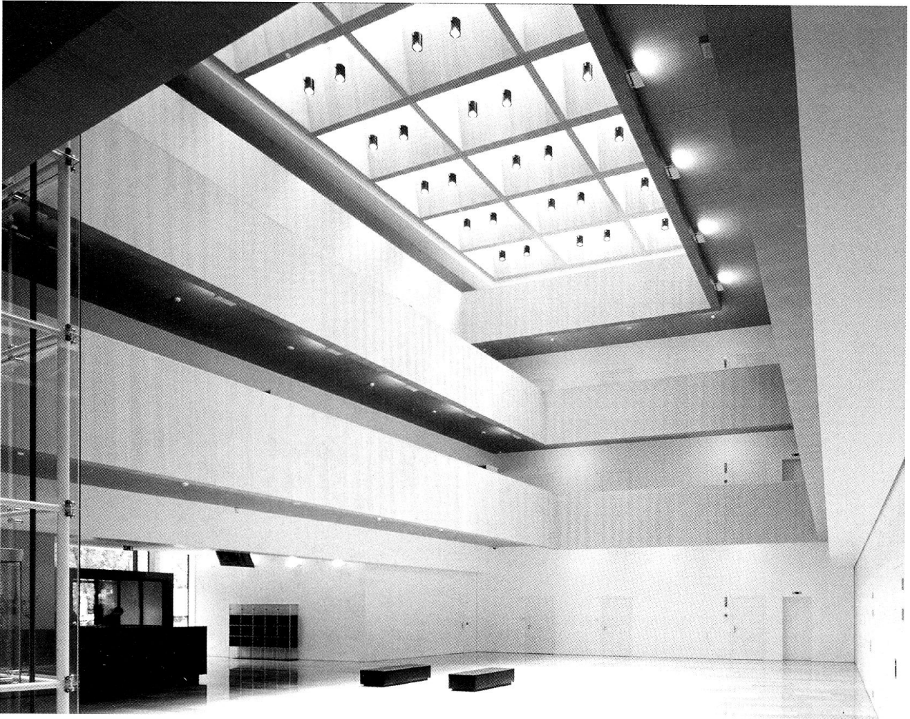
Die zentrale Halle des Würthgebäudes, wo Kunstausstellungen gezeigt werden.