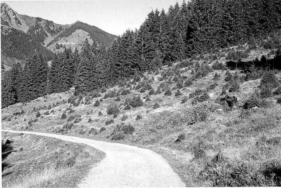
Die Waldausdehnung ex ante betrachtet bei Plaun Mieze im Val Tujetsch: Fichten wachsen auf landwirtschaftlich genutztem Land, hier auf einer Weide.