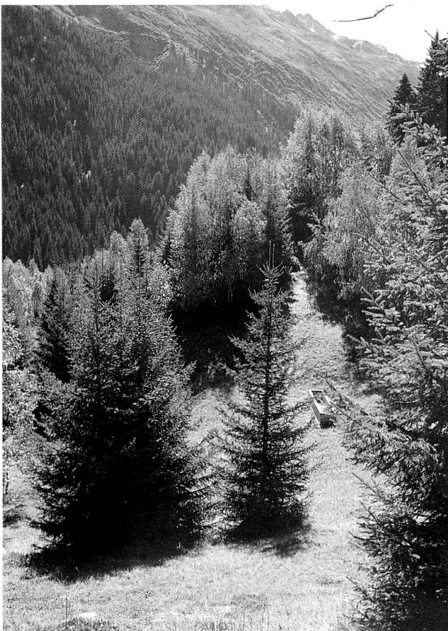
Einwachsende Wiesen oberhalb von Surrein (Val Tujetsch).

Wer hingegen einen weiteren Betrachtungsraum wählt, richtet auch auf der Suche nach Lösungen den Blick nicht mehr hauptsächlich auf die einzelbetriebliche, sondern auf die politische Ebene. So hat etwa der Bündner Grossrat Johannes Pfenninger zu bedenken gegeben, dass jede Landschaft einer Dynamik unterstellt sei und darum eine Bewirtschaftung benötige: 12 «Wir müssen für die Landwirtschaft, und speziell für diejenige im Berggebiet, gute Rahmenbedingungen schaffen, damit wir diese Kulturlandschaft in etwa so erhalten können.»