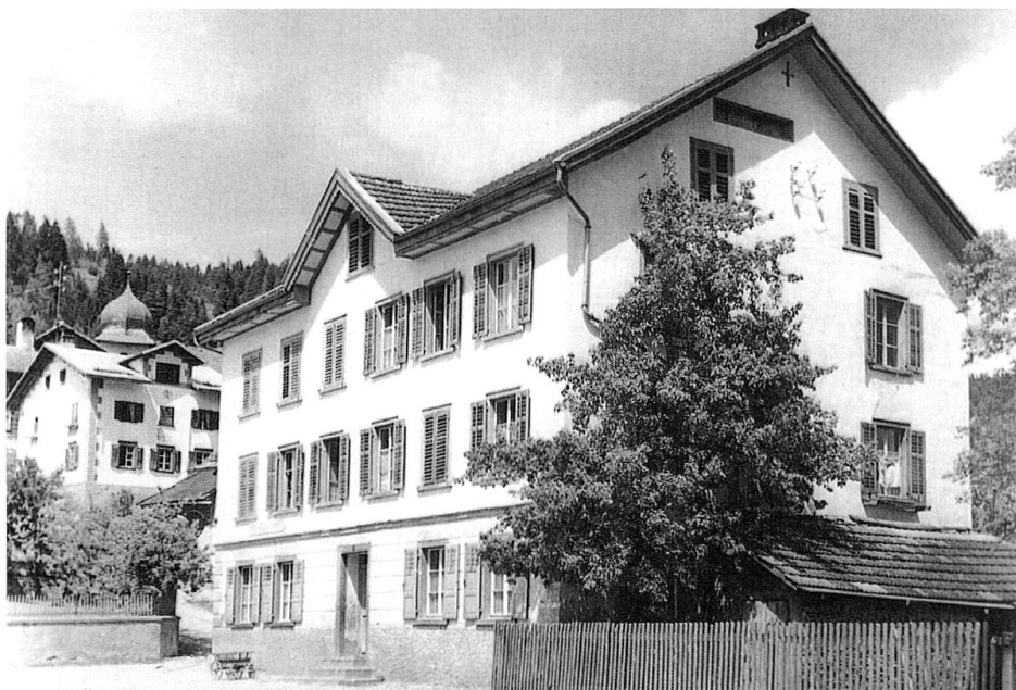
Das Haus am Platz in Sagogn. Im Erdgeschoss befand sich die Gaststube und der Kolonialwarenladen, im ersten Stock wohnte Antonia Cavelti mit ihrer Mutter und den Schwestern, im zweiten Stock die Familie Cadieli. Fotografie um 1950.

eine zweite Mutter. 60 Rosalia entlastete die Mutter mehr und mehr in der Haushaltsführung. Sie war gut bewandert in der Vermögensverwaltung, geschickt im Nähen, Stricken und Sticken und zudem eine ausgezeichnete Köchin. Laut mündlicher Überlieferung war sie energisch und konnte sich gut durchsetzen. 61