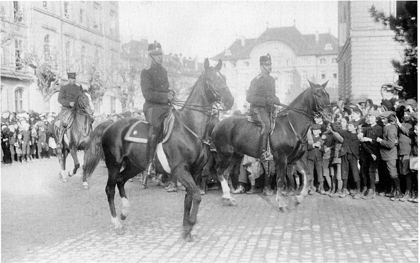
Der Generalstabschef reitet mit Offizieren des Armeestabs vor das Bundeshaus West (Schweizerische Grenzbesetzung. Heft III. Frobenius-Verlag, Basel, 1915).

In einer Eingabe an den Bundesrat vom 18. Juni 1918 wies Sprecher auf die unklaren Kompetenzabgrenzungen und Beziehungen zwischen Bund, Kantonen, militärischen Platzkommandos, Truppen der Armee und Polizeikräften hin und unterstrich die Notwendigkeit des Erlasses eines Gesetzes oder einer Verordnung über den «Belagerungszustand oder den Zustand des verschärften Schutzes.» 10 Er begründete seinen Vorstoss mit den rechtlich bisher unklar verbliebenen Verantwortlichkeiten, welche zielbewusstes Handeln hemmen würden: «Die derzeitige Unklarheit schliesst grosse Gefahren für alle in sich, die mit der Verhütung oder Unterdrückung öffentlicher Unruhen zu tun haben; die Verantwortlichkeiten sind nicht klar ausgeschrieben, und so besteht die Gefahr, dass niemand zu kraftvollem Handeln den Mut findet. Andererseits setzt sich jeder, der entschlossen eingreift, dem Vorwurf der Willkür aus [...]» Der rechtliche Hintergrund dieser Problematik bestand darin, dass die geltende Militärorganisation 1907 lediglich zwischen den Rechtszuständen des Friedensdienstes und des Kriegsdienstes unterschied, nicht jedoch die dazwischen liegende bewaffnete Neutralität erfasste. Aus dieser ungenügenden Rechtsgrundlage konnten sich bei einem allfälligen Ordnungsdiensteinsatz gefährliche Kompetenzkonflikte