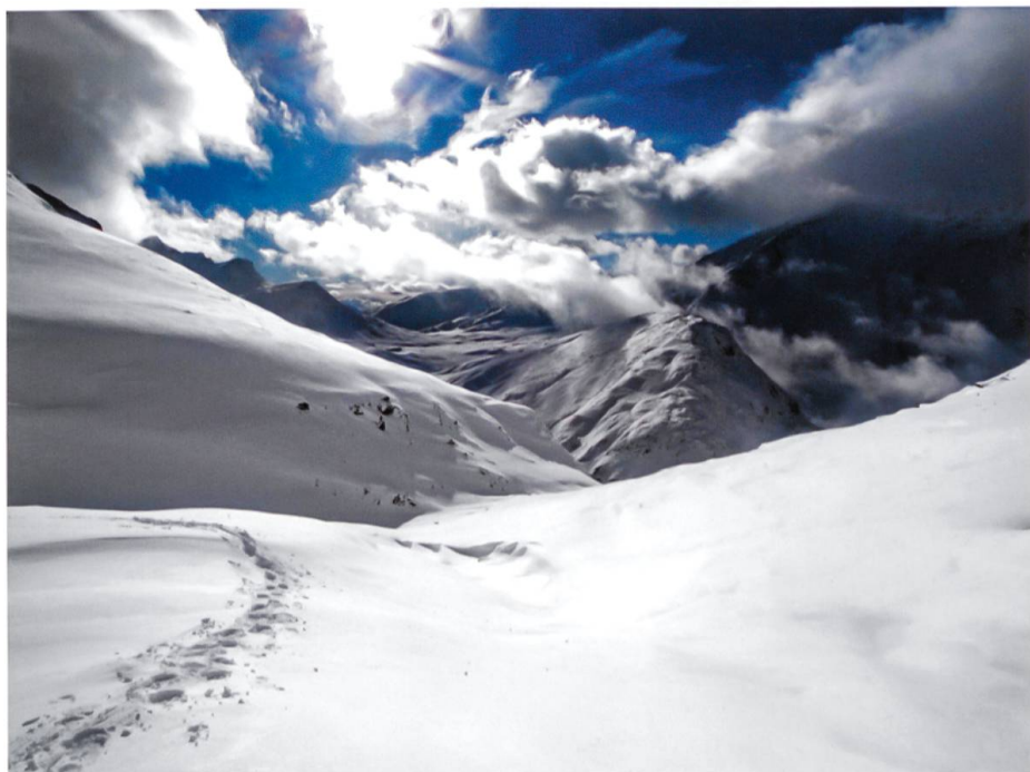
Blick vom Pass Diesrut in die Greina.

Vorstellung von einer vollends befreiten Natur noch die Inszenierung urtümlicher Lebensweisen können dem Anspruch auf Verwirklichung eines ganzheitlichen Lebensraumes genügen.