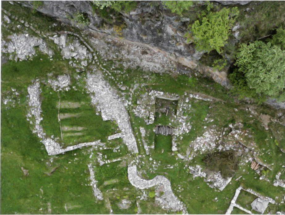
Scatta, Luftbild, links, unterhalb des Felsbandes die obere Einfriedung der Siedlung (Foto Archäologischer Dienst Graubünden).

Terrassen Weizen, Roggen, Gerste, Flachs und Hirse angebaut wurde, 10 gegen Ende des 18. Jahrhunderts auch Kartoffeln. 11 Die Terrassierungen wurden 2015 im Rahmen des Projektes Landschaftsaufwertung Calvario wieder instand gesetzt.