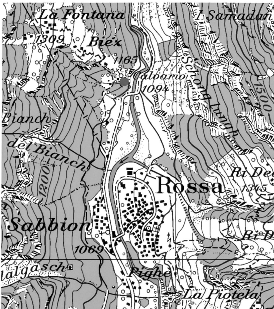
Kartenausschnitt Gemeinde Rossa mit der Wüstung Scatta, rot eingezeichnet (Reproduziert mit Bewilligung von swisstopo [BA16029]).

Ausgangspunkt dieses Artikels ist die einzigartig gelegene Wüstung Scatta im Calancatal. Der verlassene Siedlungsplatz mit seinen zahlreichen Ruinenresten findet sich auf einer südexponierten Terrasse unweit von Rossa, der letzten und nördlichsten Gemeinde des Bündner Südtals. Die Wüstung erstreckt sich 1165 m ü. M. auf der rechten Talseite oberhalb des Hauptflusses Calancasca, an einem nach Süden abfallenden Hang. Sowohl im Norden als auch im Osten wird das ehemalige Siedlungsareal durch Felsbänder, im Westen durch einen natürlichen Geländeeinschnitt mit einem Bachlauf begrenzt. Die Fläche der Wüstung beträgt 7500 m 2 und