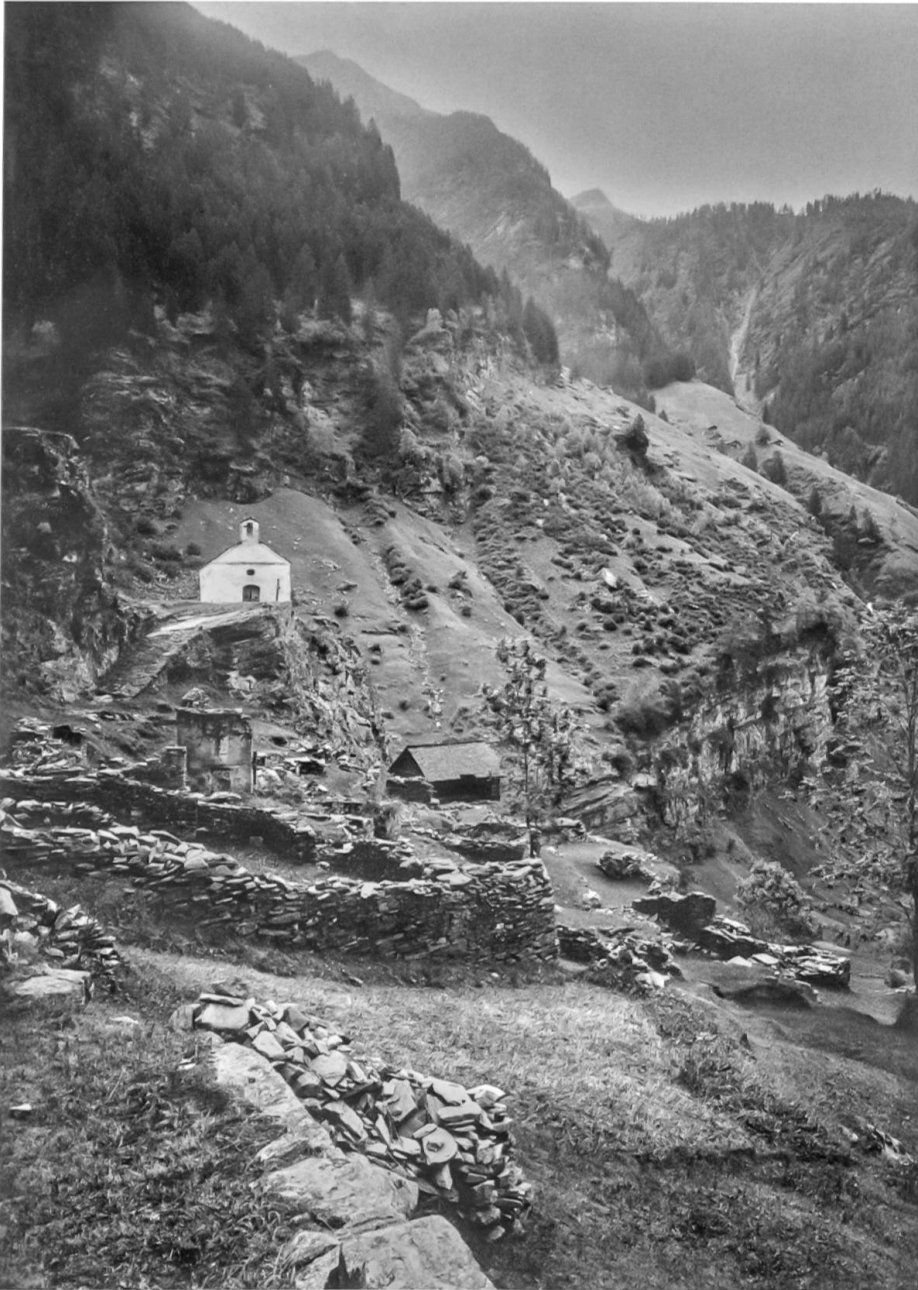
Scatta um 1930, mit noch besser erhaltenen Ruinen. Das Mauerfragment des Wohnbaus links unterhalb der Kapelle zeigt einen äusseren Wandverputz (Foto Schweizerische Nationalbibliothek, Eidgenössisches Archiv für Denkmalpflege (EAD): Archiv Rudolf Zinggeler (EAD-ZING-1683).

geländebedingt ebenerdig ins Innere. Bei den besser erhaltenen Wohnbauten liessen sich im Mauerwerk Unterschiede zwischen Hinter- und Vorderhaus beobachten. Zum einen ist die Mauerstärke des Vorderhauses (Sockelgeschoss) stets etwas massiver mit 0,70–0,80 m als die des Hinterhauses mit 0,60–0,70 m. Das Mauerwerk des Hinterhauses ist jeweils mit kleineren Steinen und sorgfältiger geschichtet, während beim Vorderhaus grössere Steine verwendet wurden, was auch zu einem weniger verdichteten Mauerwerk führt.