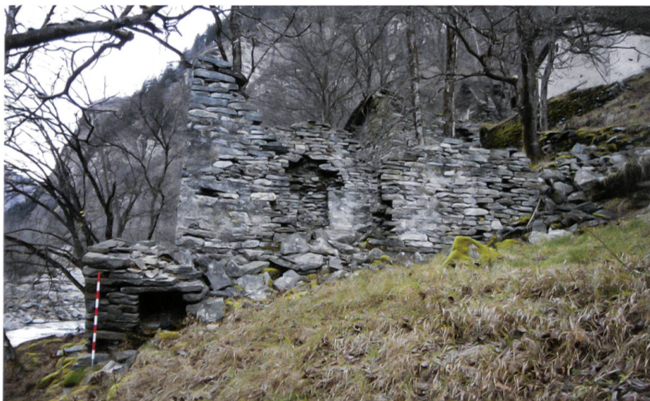
Dapc da Fora, südlich von Arvigo. Ruine eines ehemaligen Wohnbaus mit einem linksseitig, vor die Hauswand gesetzten Backofen.

den Kapellen und ist an die äussere Hauswand eines zweiräumigen Wohngebäudes gebaut. Der Bau ist in einem schlechten Zustand und mit Schuttmaterial bedeckt. Seine Aussenmasse liegen bei rund 2,45 x 2,35 m. Die Identifizierung dieser zerfallenen Struktur als Backofen gelang nur mit Hilfe der Einheimischen Eleanore Bacchini. Nach der 86-jährigen Informantin handelte es sich um einen freistehenden Backofen, ohne Schutzbau; er war zur Zeit ihrer Jugend noch deutlich besser erhalten. Ein Vergleichsbeispiel fand sich nur mehr in der Wüstung Dapc da Fora, südlich von Arvigo.