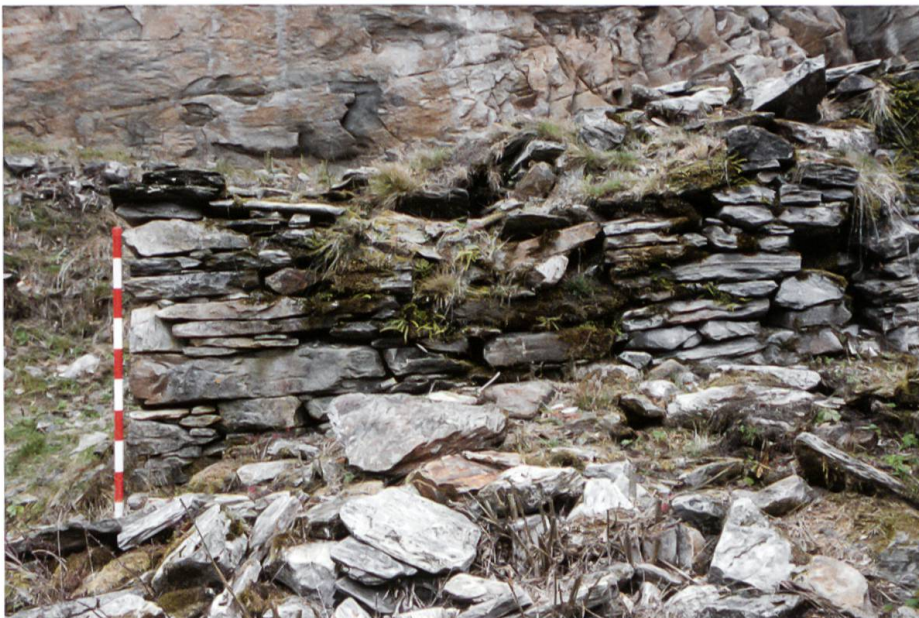
Scatta, Blick nach Norden. Südansicht der als Backofen identifizierten Struktur.

Gemeinschaftlich genutzt wurde wohl der einzige nachweisbare Backofen der Siedlung. Er liegt an der Wegkreuzung zu den bei-