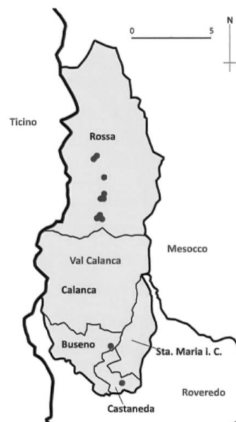
Karte Val Calanca. Grau: Gemeinden Calancatal. Rot: Dendrochronologische Untersuchungen. (Y. Alther, Datengrundlage: Dendrolabor ADG, 2005–2015.)

Zum Vergleich die Datierungen der Kirchen des Calancatal. Sie sind zum Teil wesentlich älter als die datierten Wohn- und Wirtschaftsbauten. Die am frühesten erwähnte Kirche in Sta. Maria datiert auf 1219, es folgen Sta. Domenica mit 1414, Buseno 1483,