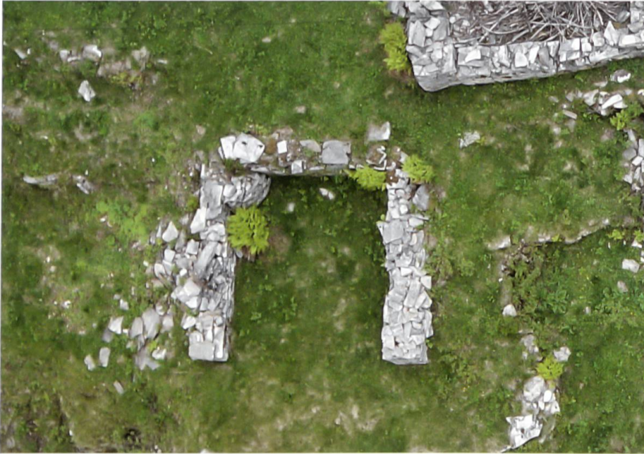
Scatta, Luftbild, Grundriss eines dreiseitig aufgemauerten Ökonomiegebäudes

Mauern aller Wirtschaftsbauten wurden ohne Mörtel, trocken aufgeführt. Die Mauerstärke differiert zwischen 0,50 m und 0,85 m. Aus der Konstruktion der beiden noch erhaltenen Stallscheunen kann geschlossen werden, dass auch der nicht mehr vorhandene Strickbau aus locker geschichteten Rundhölzern bestand. Diese Bauten dürften neben ihrer Funktion als Stallscheune auch als torba , Speicher, gedient haben. Bei den kleineren Grundrissen sowie bei drei an Wohnbauten angefügten Nebenbauten darf auch eine Verwendung als Vorratsraum, Kleinvieh- oder Schweinestall angenommen werden.