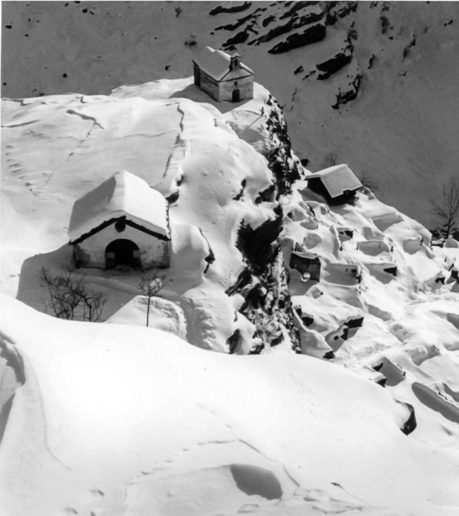
Winteraufnahme der Wüstung Scatta, um 1940.

Gesellschaft für Volkskunde) beigezogen werden. Anhand des Luftbilds von 1933 (Bundesamt für Landestopographie swisstopo) sowie den Aufnahmen von Oscar Good (1880–1945; Archivio regionale Calanca, Cauco) liess sich aufzeigen, dass das Gebiet von Scatta noch bis ins 20. Jahrhundert landwirtschaftlich genutzt wurde.