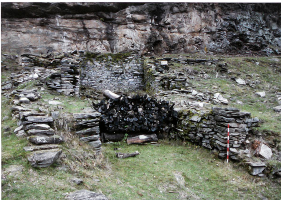
Scatta, Beispiel eines zweiräumigen Wohnbaus. Im Vordergrund das dreiseitig gemauerte Vorderhaus. Der darüber gesetzte Blockbau hat sich nicht erhalten. Rückseitig gegen den Fels, das vollständig gemauerte Hinterhaus.

Die Erschliessung des Sockelgeschosses, des Stalls im Vorderhaus, erfolgte bei drei Gebäuden über die talauswärts orientierte Frontseite und bei einem Gebäude traufseitig auf der Ostseite. Der Zugang in die Küche (Hinterhaus) führte über die Traufseite und