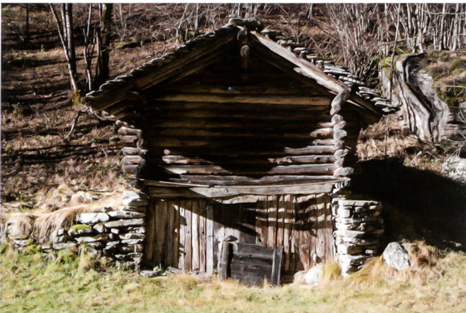
Vergleichsbeispiel aus Arvigo, dreiseitig gemauerter Heustall mit einer Bohlenfront.

Mauern aller Wirtschaftsbauten wurden ohne Mörtel, trocken aufgeführt. Die Mauerstärke differiert zwischen 0,50 m und 0,85 m. Aus der Konstruktion der beiden noch erhaltenen Stallscheunen kann geschlossen werden, dass auch der nicht mehr vorhandene Strickbau aus locker geschichteten Rundhölzern bestand. Diese Bauten dürften neben ihrer Funktion als Stallscheune auch als torba , Speicher, gedient haben. Bei den kleineren Grundrissen sowie bei drei an Wohnbauten angefügten Nebenbauten darf auch eine Verwendung als Vorratsraum, Kleinvieh- oder Schweinestall angenommen werden.