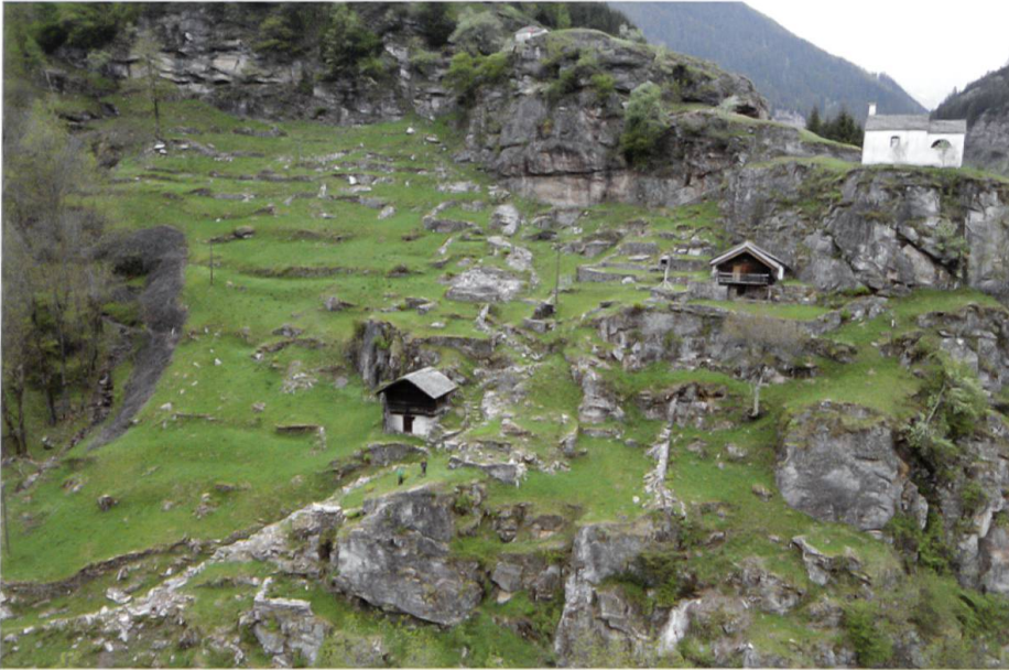
Die Wüstung Scatta mit den zwei noch erhaltenen Stallscheunen und der Kapelle S. Maria Maddalena al Calvario, rechts und der kleineren Kapelle Madonna del Sangue, am oberen Bildrand in der Mitte.

ländes liessen sich mindestens 18 Terrassierungsmauern festhalten. Die Mauerzüge verlaufen in Ost-West-Richtung und werden auf der Westseite durch den Geländeeinschnitt mit dem Bachlauf begrenzt. Hier handelt es sich um die ehemaligen Ackerbauflächen der Siedlung.