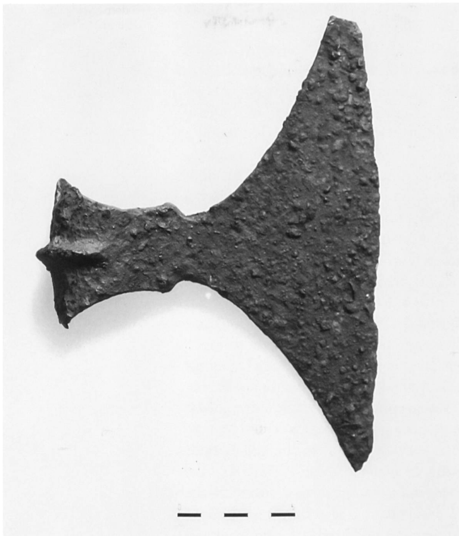
Bivio, Septimerpass, eiserne Hellebardenaxt (Foto: ADG).

über 30 Schleuderbleie mit Legionsstempeln. Ich begleitete den Sondengänger mehrere Male im Gelände und gab ihm exakte Instruktionen zur Funddokumentation und fand selbst auch mehrere Schleuderbleie und weitere römische Metallobjekte.