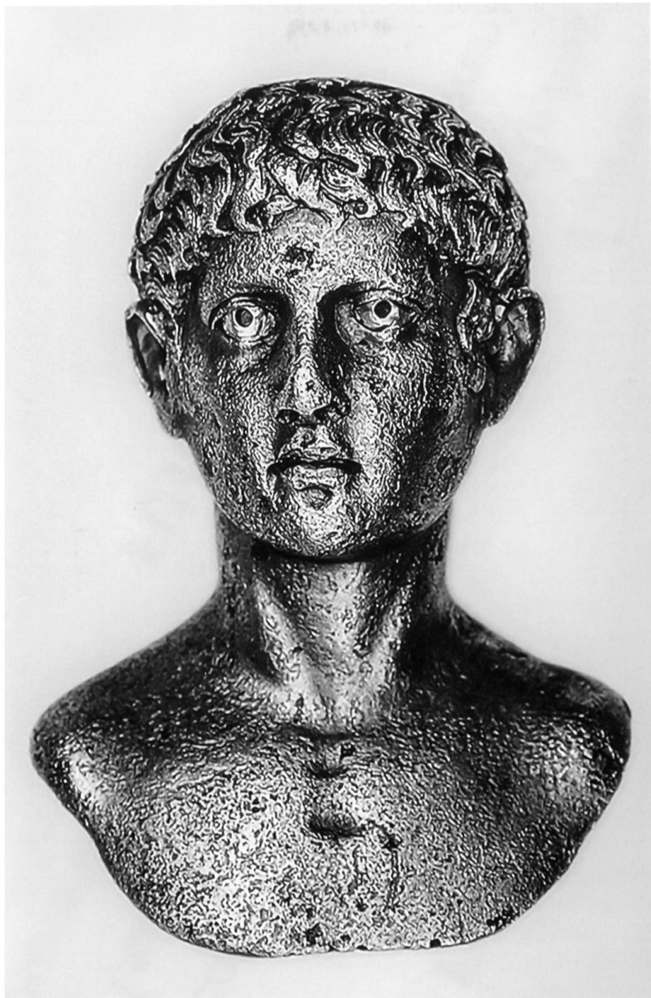
Römisches Bronzeköpfchen aus dem Kieswerk Tardis bei Landquart.

und wisse nicht mehr, was er mit dem Fundobjekt anfangen solle. Zwei Tage später suchte ich den Italiener und seine Gemahlin in Domat/Ems auf. Der Gastarbeiter legte mir ein wunderschönes römisches Bronzeköpfchen eines Jünglings mit sorgfältig gestalterter Haartracht, in Silber ausgelegten Augäpfeln und einem Bleikörper im innern Hohlraum der Brust und des Halses vor. Mich erinnerte das Köpfchen zunächst an ein Porträt des jungen Augustus (Octavian). Was mich allerdings schon auf den ersten Blick