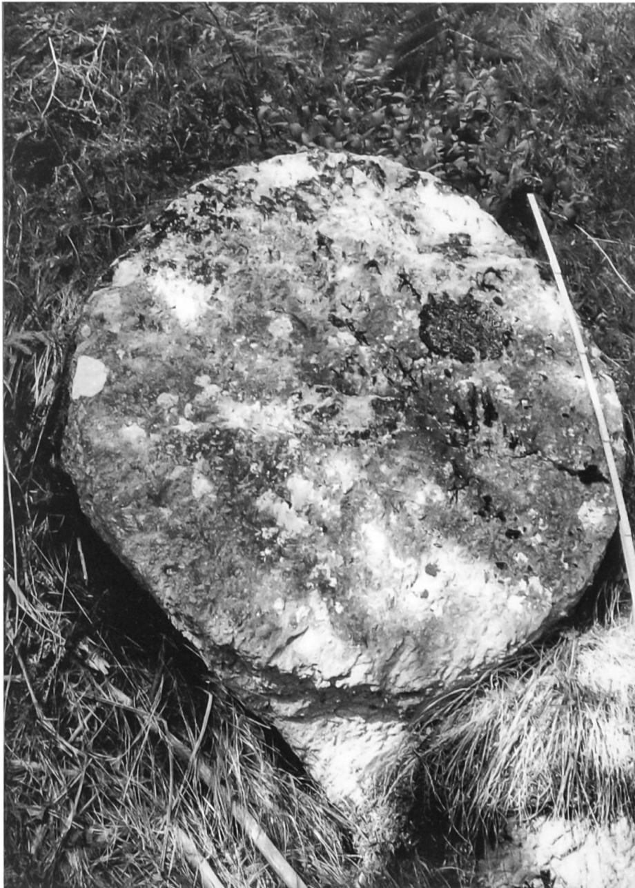
Schluein, westlich Pastiras, Sonnenstein oder Mühlstein?

Im Jahr 2003 teilte mir Frau Y. aus Zürich mit, dass auf Gemeindegebiet von Schluein von einem Einheimischen ein weiterer, ebenfalls nach Süden orientierter «Sonnenstein» entdeckt worden war. Nach längerem Suchen fand ich schliesslich diesen Schlueiner «Sonnenstein» in einer massiven Bergsturzzone mit reichhaltigem Versturzmateriale: eine Steinplatte aus Verrucano von rund 18 cm Dicke, kreisrund zugearbeitet mit einem Durchmesser von 112–114 cm. Ein zentrales Zirkelloch fehlte, doch liess sich auf der Oberfläche des Steinkreises eine dezentrale Schale von 3 cm Durchmesser beobachten. In seinem unteren Teil wies die Steinscheibe eine Art Sockel auf, von dem der Steinkreis noch nicht