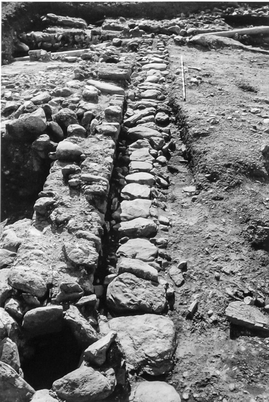
Riom-Parsonz, Cadra, 1981; römische, mit Steinplatten überdeckte Abwasserleitung neben dem Gebäude mit Hypokaustanlage.

In den Jahren 1980 bis 1983 legte der ADG in Riom-Parsonz, Cadra an der mit Wagen befahrbaren römischen Julierstrasse eine Pferdewechselstation ( mutatio ) frei. Dabei wurde ein Hauptgebäude von rund 30 m Länge und 20 m Breite gefasst. In dessen Osttrakt fanden sich Wand- und Deckenmalereien mit einer Amordarstellung, im Mitteltrakt eine Hypokaustanlage, also eine Unterboden-Warmluftheizung und im Westtrakt Wohnräume