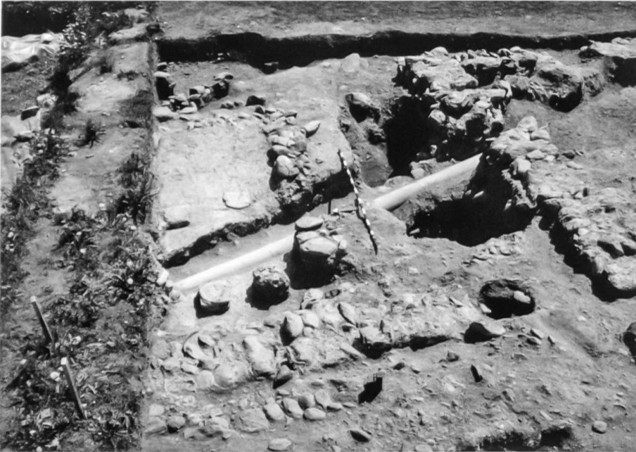
Riom-Parsonz, Cadra, 1982: Raum mit Hypokaustanlage und rezentem Kanalisations- rohr (Foto: ADG).

bereich von Riom eine neue Kanalisation erstellt habe, an die alle alten Kanalisationsrohre angehängt worden seien. Für den Grabungstechniker der entscheidende Anlass, das Kanalisationsrohr im Grabungsbereich unverzüglich abzubrechen.