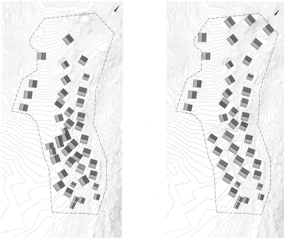
Die linke Skizze zeigt die ursprüngliche Siedlungsstruktur, die rechte die neue Siedlungsstruktur mit den neu definierten Aussenräumen.

an den Rand der Siedlung gestellt, die restlichen neun können am alten Ort gebaut werden.