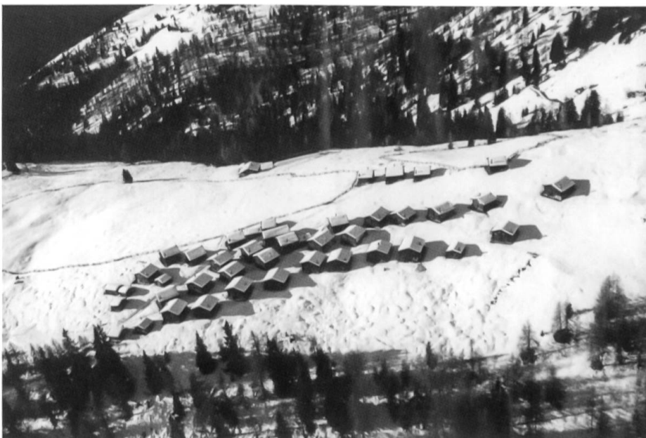
Die Wiesner Alp in einer historischen Aufnahme. So präsentierte sich die Siedlung, bis am 10. November 2007 ein Brand im nordwestlichen Teil 14 Hütten zerstörte.

Auf einem leicht ansteigenden Geländerücken gruppieren sich etwa vierzig Hütten und Ställe zu einer kompakten Siedlung. Sie ist noch tief verschneit. Wir bleiben in dieser wattierten Stille stehen, blicken ins Tal und augenblicklich wird uns klar, weshalb dieser Ort nicht nur Siedlungsforscher zum Verweilen lockt. Der Ort ist ein Idyll und die Aussicht schlicht phänomenal. Gegenüber am Horizont leuchten die Berggüner Stöcke im Mittagslicht, der Piz Ela, das Corn da Tinizong, der Piz Mitgel; dieses dominante Dreigestirn des Albulatales hatte einst auch den Expressionisten Ernst Ludwig Kirchner (1880–1938) in seinen Bann gezogen.