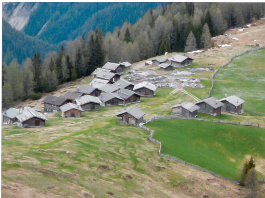
Rechts grenzt eingefriedetes Weidland an die sog. «soppa».