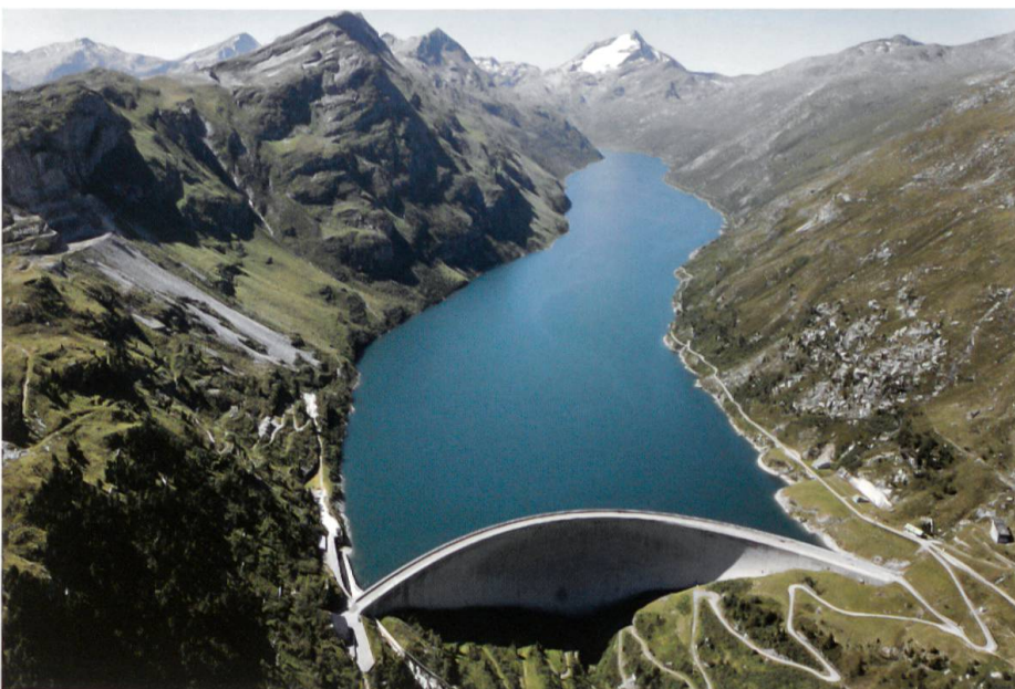
Der gefüllte See mit dem Pizzo Stella im Hintergrund. Der Stausee ist ein beliebtes touristisches Ausflugsziel (Foto: Mathias Kunfermann, KHR).

Der Stausee Valle di Lei liegt auf italienischem Staatsgebiet, das Wasser wird aber auf Schweizer Seite in den Zentralen Ferrera, Bärenburg und Sils im Domleschg genutzt. Ähnlich verhält es sich beim Lago di Livigno der Engadiner Kraftwerke. Der Speicher liegt in Italien, das Wasser wird aber in den Turbinen der Zentralen Ova Spin bei Zernez und Pradella unterhalb Scuol verstromt. Der Unterschied besteht darin, dass bei den Kraftwerken Hinterrhein die italienische Edison S.p.A. mit 20 Prozent beteiligt ist, bei den Engadiner Kraftwerken verfügt der italienische Nachbar hingegen über keine Beteiligung. Italien hat dafür aber das