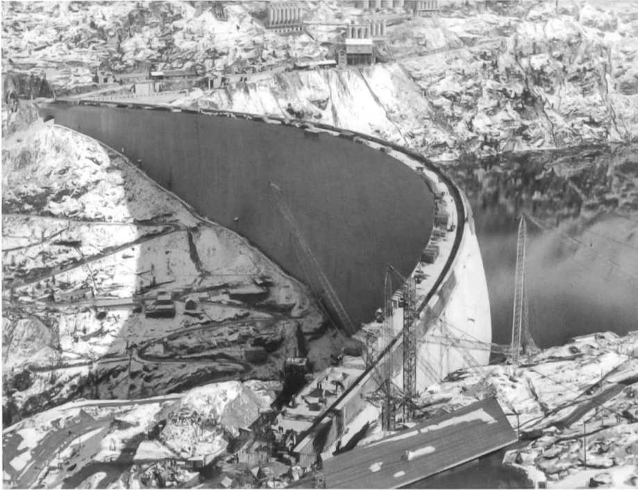
Die Staumauer kurz vor der Fertigstellung. Dank rasant fortschreitender Mechanisierung der Beton- und Kieszubereitung, der Verwendung von Kabelkranen und dem Ausbau der Transportwege gingen die Arbeiten sehr schnell voran.

chen, wobei die Staumöglichkeiten im Aversertal und besonders jene in der Valle di Lei als Ersatzmöglichkeiten in den Vordergrund treten, letzter käme allerdings auf italienisches Gebiet zu liegen. Die Staumauer könnte mit italienischer Arbeit und italienischem Material bedeutend billiger erstellt werden als die Mauer bei Splügen; es würden keine Umsiedlungskosten entstehen und ferner würde die Stauung etwa 400 m höher oben als im Rheinwald erfolgen. Im Sommer könnte auch Hinterrhein-Wasser durch den Stollen vom Stausee Sufers nach Innerferrera geleitet und in den Stausee Valle di Lei gepumpt werden.» 13