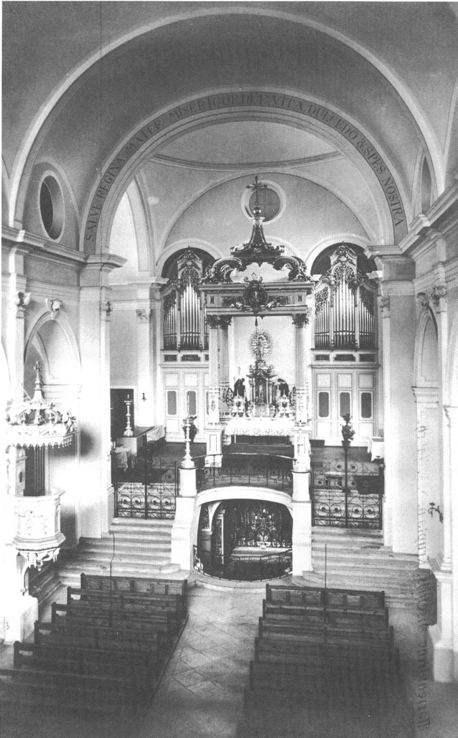
Blick ins Innere der Hardegger-Marienkirche.