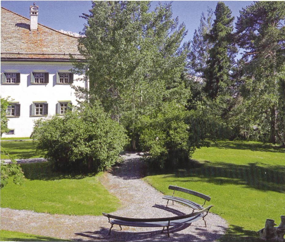
Noch heute zieren geschwungene Wege den Garten der Chesa Planta in Samedan. In den Rasenflächen gab es jedoch ursprünglich viele aufwändig bepflanzte rundliche und blasenförmige Blumenbeete.

Eindrücken aus der Jugendzeit in den Niederlanden mit der traditionsreichen Gartenkultur entwickelt haben. 2 Verschiedene Entwürfe – wohl um die Mitte des 19. Jahrhunderts entstanden – zeigen die unregelmässig gebogen geführten Wege und die kleineren und grösseren Blumenbeete mit gerundeten, vielgestaltigen Formen, die in den Rasenflächen angelegt werden sollten. Man richtete sich offensichtlich mit Begeisterung nach dem zeitgemässen Landschaftsgartenstil und schuf damit eine zwar kleine, aber in ihrer Art fürs Engadin wohl einzigartige Anlage. Gemäss einer 1875 erschienenen Kulturgeschichte Graubündens war die Zahl der «Kunstgärten» wegen des rauhen Klimas in allen andern Gegenden als dem Domleschg und dem Rheintal in Churs Umgebung auch bei den Herrschaftssitzen sehr beschränkt. Die etwas besser gestellten Engadinerinnen sollen ihre Gärten fast ausschliesslich zum Blumen- und Flachs-anbau und nicht zum Gemüseanbau verwendet haben. Allerdings hätten manche Frauen ihren Eheliebsten in fremden Diensten nahegelegt, beim Urlaub ausser Blumensamen doch auch feine Gemüse- und Blumensamen aus Holland, Frankreich, Österreich und Italien mitzubringen. 3