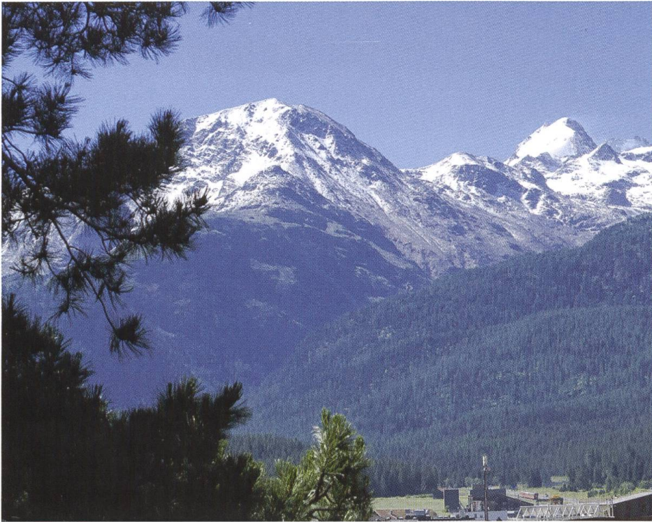
Aussicht vom Garten ins Berninagebiet. Schöne Ausblicke waren den Gestaltern von Landschaftsgärten sehr wichtig.

Rechte Seite oben: Projekt von Gartenarchitekt Ernst Klingelfuss aus dem Jahr 1906 für eine Gestaltung des damals höchstens von Wildwuchs bedeckten Hangs Richtung Bahnhof. Es war auch ein grottenartiger Bachauslauf und ein Bassin mit Springbrunnen geplant.