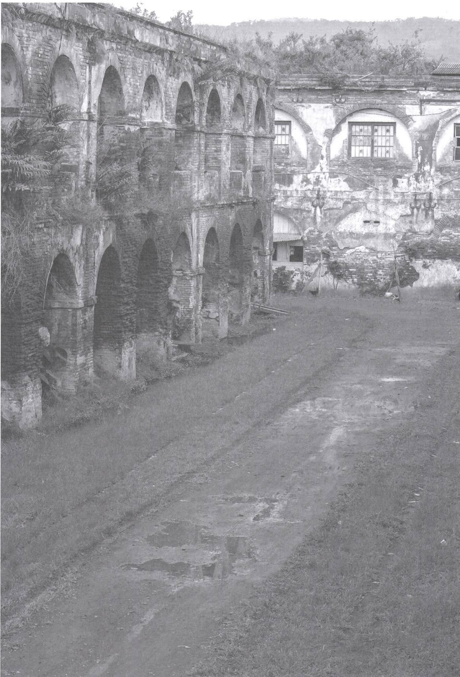
Blick auf die verlassene Festung Wilem I (Foto: Yoga Krissawindaru).

Wegen der spärlichen Nachrichten beginnt sich der Vater Sorgen zu machen und schreibt an alle möglichen Stellen. Ein halbes Jahr müsste die Familie normalerweise auf eine Antwort warten, doch es dauert beinahe anderthalb Jahre, bis sie wieder etwas von ihm hören. Und auch in diesem Brief ist wenig über sein Zustand zu erfahren, denn er überdeckt sein Heimweh und spielt den heroischen Soldaten. Von verschiedenen Seiten erfährt Constanz, dass