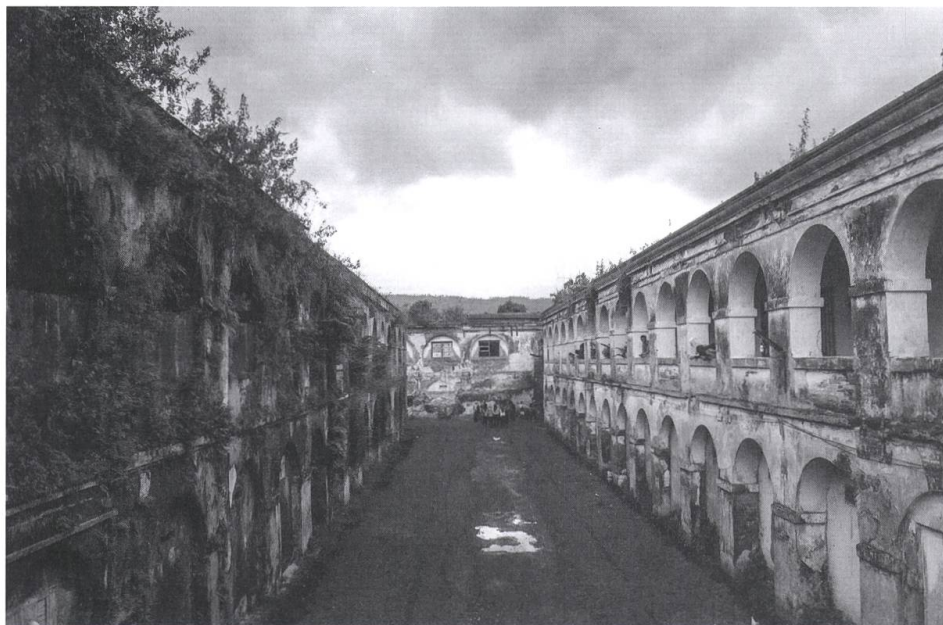
Beinahe Weltgeschichte geschrieben: Auch auf Willem I wurden Umsturzpläne geschmiedet (Foto: Yoga Krissawindaru).

wollten, damit eine dieser Mächte die Kolonie von den Niederländern übernehme.