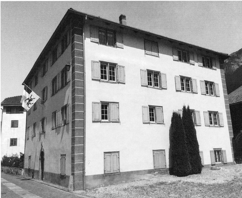
Das heutige Haus in Andeer der Erben Rosa Burga-Piccoli.