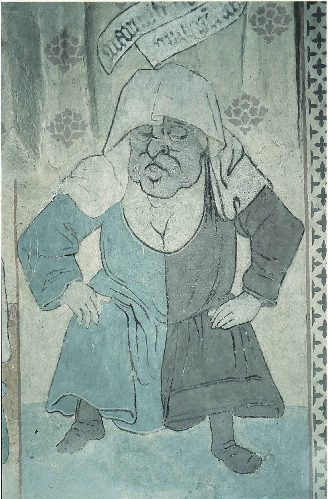
Abb. 5: Markolfs Frau