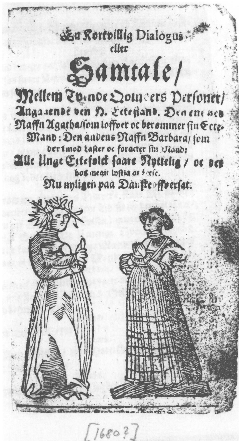
Abb. 2: Titelblatt des dänischen Drucks ‚En Kortvillig Dialogus‘ (1680?). Det Kongelige Bibliotek København.