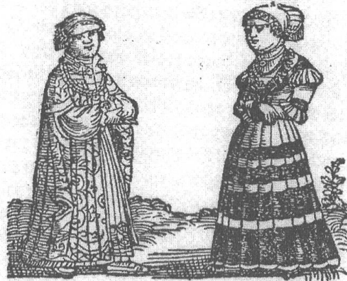
Abb. 1: Erasmus Alberus, Das Ehbüchlin (1539). Titelblatt. Zentralbibliothek Zürich.