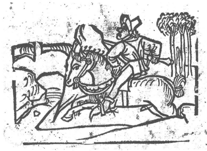
Abb. 8: Holzschnitt der letzten Seite von (D1). 121 Ein Reiter mit Schwert soll möglicherweise den Abt darstellen, der den in Pferdegestalt auftretenden Rus zurück ins Sachsenland bringt. 122

Auf der einen Seite steckt in diesen Äußerungen die Aufforderung an sämtliche Katholiken, sich umgehend zum reformierten Christentum zu bekennen, während auf der anderen Seite die vermeintlichen Erlöser angesprochen sind, selbst bei Gott um Errettung zu bitten, was nicht nur als barmherziges Angebot, sondern auch als Diffamierung verstanden werden kann. Diese Zeilen bestätigen demnach die Annahme, dass die dänische Fassung (D1) neben dem unterhaltenden Aspekt eindeutig eine pro-reformatorische Funktion ausübt. Die Frage, wieso sich diese Fassung 19 Jahre nach der offiziellen Einführung der Reformation in Dänemark 123 so stark gegen den Katholizismus ausspricht, kann nur hypothetisch beantwortet werden. So weist auch diese Beobachtung darauf hin 124 , dass es sich um eine Abschrift eines älteren, nicht überlieferten Druckes handelt. Frandsen vermutet die Existenz eines solchen im Jahr 1531, 125 was gut zu der eben ausgeführten Funktion passen würde.