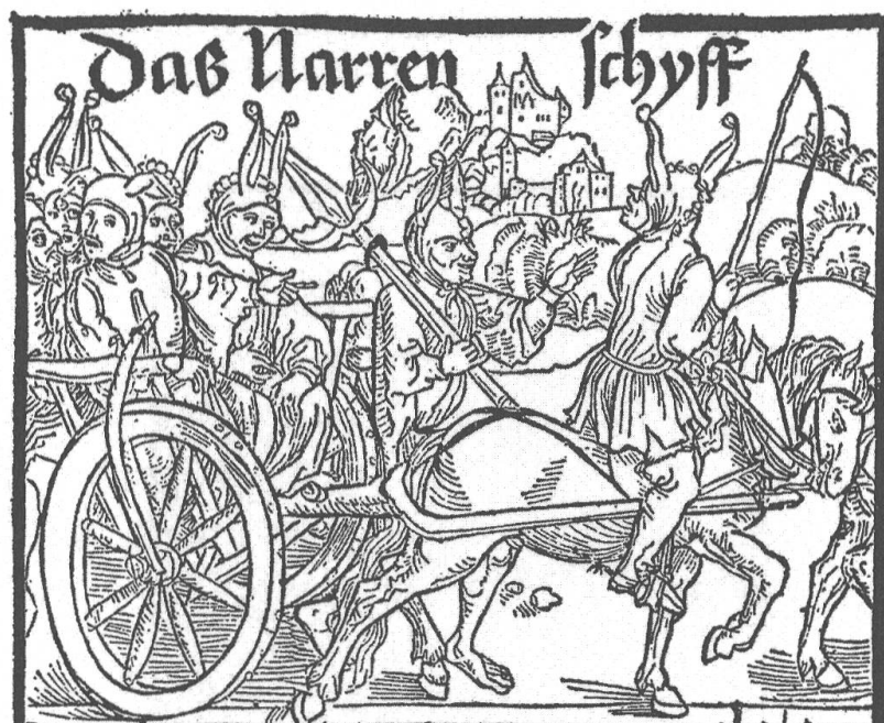
Abb. 6: Obere Hälfte des Titelblattes von Sebastian Brants „Narrenschiff“. 55