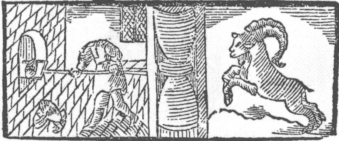
Abb. 2: Titelholzschnitt von (S1) in SF, 1948. 47 Der Bäckerjunge erscheint mit retuschiertem Kopf.