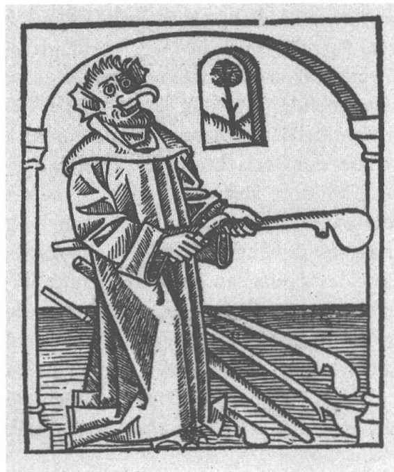
Abb. 3: Titelholzschnitt von (A), 1488. 48 Der in einer Mönchskutte auftretende Rauschen weist etliche Teufelscharakteristika auf. Dazu zählen die Fledermausohren, die weit aufgerissenen Augen, die gesträubten Haare, der Bocksbart sowie die mächtige Nase.