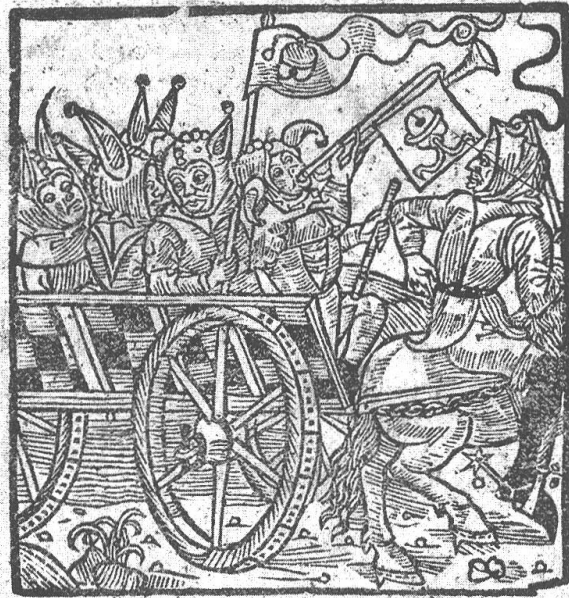
Abb. 5: Holzschnitt auf Seite 2 von (D1), 1555. 54 Fünf Narren sitzen in einem Leiterwagen, der von einem Pferd gezogen wird. Auf diesem befindet sich eine weitere Person, die vermutlich Bruder Rauschen darstellen soll, da es sich um die einzig gesondert abgebildete Figur handelt.

handelt, welche sich auf einer Reise mit ungewissem Ziel befinden. 52 Dies würde auch das Entfernen des Hintergrundes erklären, was eine Lokalisierung verunmöglicht. Zudem suggerieren verschiedene Instrumente, dass von Bruder Rauschen und seiner Schar ein lautes Getöse ausging. 53