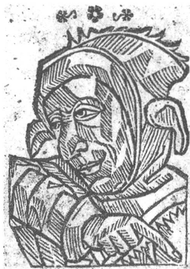
Abb. 4: Titelholzschnitt von (D1), 1555. 49 Rauschen zeigt mit seinem rechten Zeigefinger auf das rechte, untere Eck und fordert dazu auf, das Buch zu öffnen resp. die Seite umzulegen.

Auf der Rückseite der ersten Blattes kommen mit einem weiteren Holzschnitt, der eine närrische Szene zeigt (Abb. 5) sowie sechs Zeilen, in denen sich der Protagonist vorstellt 50 , zwei ausschließlich in (D1) vorhandene Elemente zum Vorschein. Ein direkter Bezug der abgebildeten Szene zu einer in der Historie von Bruder Rauschen vorkommenden Episode ist nicht zu erkennen, vielmehr macht es den Anschein, als stamme der Holzschnitt aus einem anderen Werk. Diese Annahme bestätigt sich bei der Betrachtung des Titelblattes von Sebastian Brants Narrenschyff (Abb. 6). Der dort auftretende Holzschnitt weist ein identisches Motiv auf. Obwohl die zwei Illustrationen in einigen Details abweichen, kann konstatiert werden, dass es sich beim Titelblatt-Holzschnitt von Brants Narrenschyff um die Vorlage des dänischen Druckes handelt. Erst in Verbindung mit den sich auf derselben Seite befindlichen sechs Zeilen, in denen sich Broder Rus vorstellt 50 , scheint die Verwendung des Bildes nachvollziehbar. Die Betrachtung des Holzschnittes unter Berücksichtigung von Bruder Rauschens Ausführungen, dass alle, welche ihm dienen, „ond løn“ 51 ernten werden, lässt vermuten, dass es sich bei den im Karren befindlichen Narren um Rauschens Anhänger oder Diener