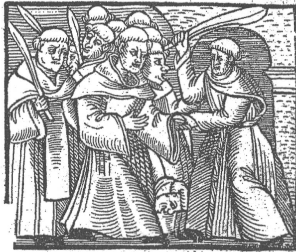
Abb. 7: Holzschnitt, Blatt 5 r , (D2), um 1600. 110 Analog zu Abb. 9 liegt auch in diesem Holzschnitt ein Bruder am Boden. Die geworfene Bank ist trotz der Erwähnung im Titel nicht ersichtlich.

Her sla Munnkene huer an dre met Knipple/ oc Broder Ruff faster en Venck iblant dennem.