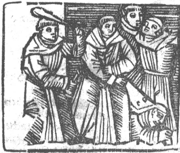
Abb. 9: Holzschnitt, Blatt 6 v , (B6), um 1560. 139