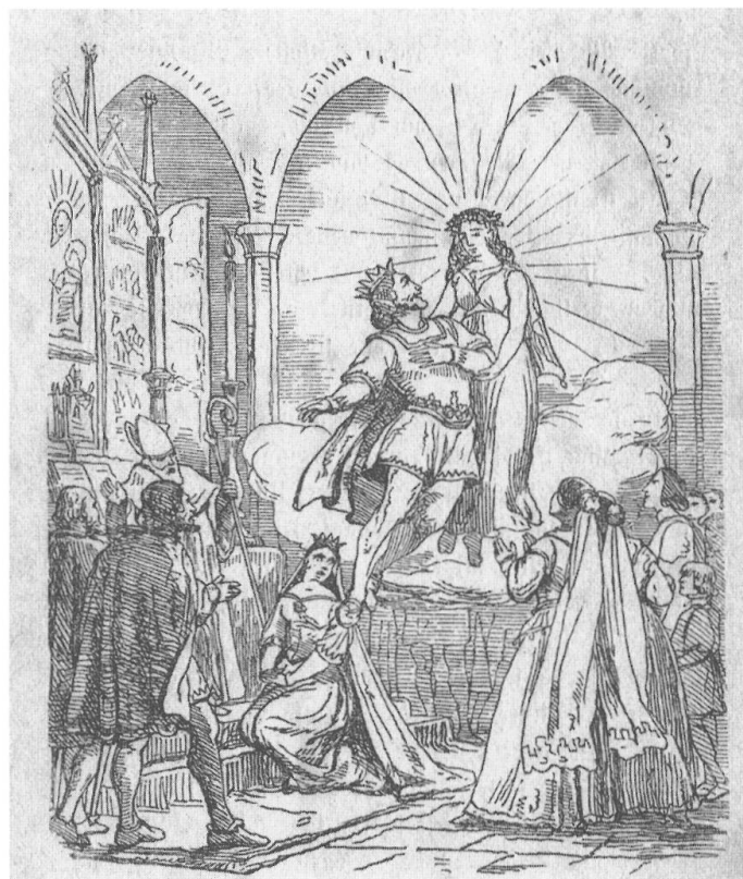
Abb. 3: Die Fee Morgua nimmt Holger Danske in ihr himmlisches Reich auf.