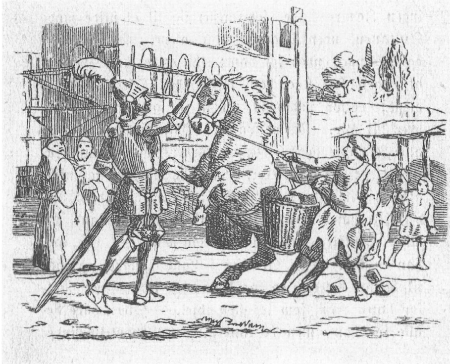
Abb. 1: Holger Danske findet sein Pferd als Lasttier auf dem Marktplatz wieder.