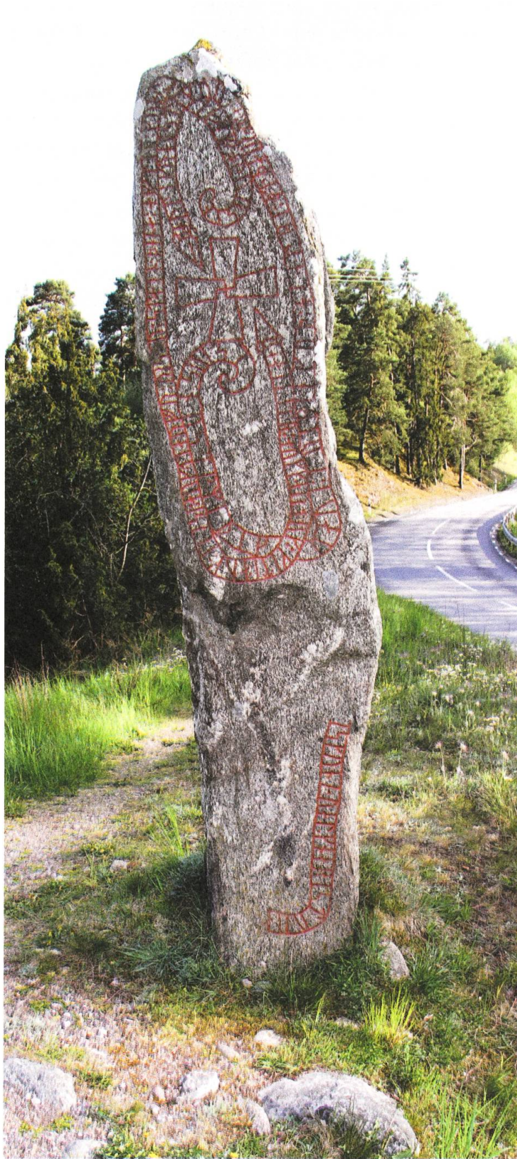
Abbildung 1: Inschrift von Varpsund (U 654).