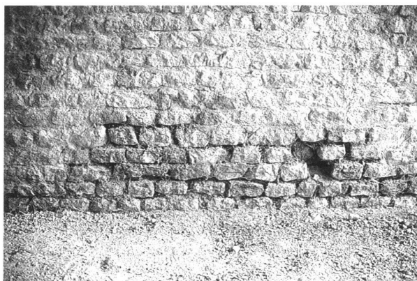
Fig. 1. Amphithéâtre. Accès orientaux, couloir sud. Au pied du mur, le mortier qui garnissait les joints du petit appareil a disparu sous l'effet de la remontée des eaux chargées de sel. Quelques moellons du parement sont déjà tombés.

Dans le couloir sud de l'entrée orientale, une importante érosion du mortier des joints était visible depuis longtemps à la base des murs (fig. 1), qui avait provoqué la chute de certaines pierres du parement. Ces dégâts sont typiques de cette zone où l'humidité du sol, remontant dans les maçonneries, s'évapore, entraînant à la surface des sels jusque là