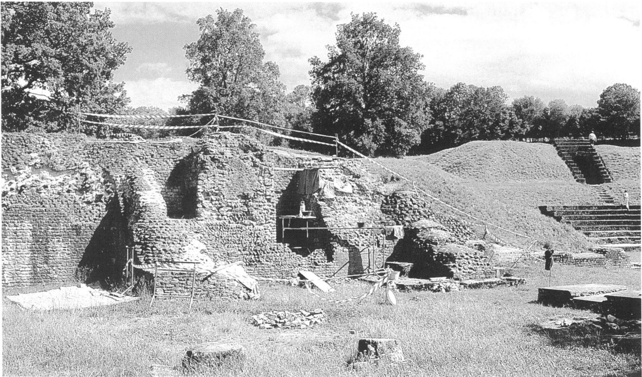
Fig. 2. Théâtre. Le mur d'analemma oriental et les chantiers de restauration.

dissous. Dès que le point de saturation est atteint, ces sels, plus ou moins facilement reconnaissables, se cristallisent en surface de la maçonnerie. Selon les conditions atmosphériques, ils peuvent à nouveau se dissoudre, pour se recristalliser à la première occasion. La cristallisation entraîne une augmentation de volume dont résulte une importante pression.