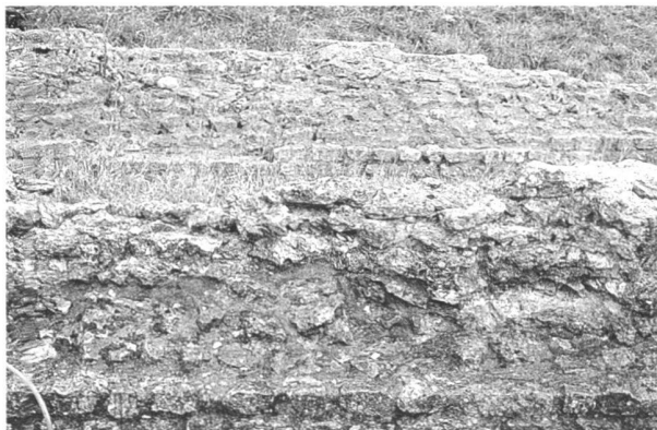
Fig. 3. Un mur rayonnant du secteur est, avant restauration : la chape de protection en mortier au ciment est endommagée et lacunaire ; le noyau de la maçonnerie originale se déchausse et serait condamné à brève échéance sans mesures de consolidation.