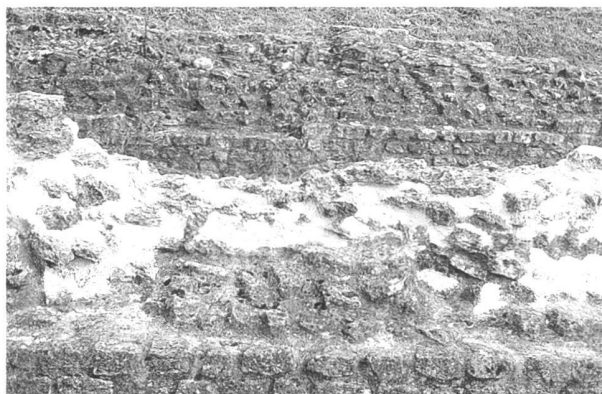
Fig. 4. Après restauration : pour assurer la conservation du noyau original, les secteurs endommagés doivent être consolidés en profondeur. Pour ce faire, on utilise un mortier à base de chaux, de pouzzolane, de tuileau et de sable.