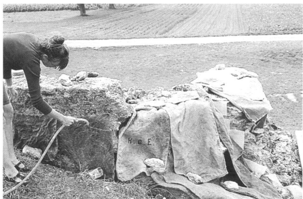
Fig. 5. Le mortier à la chaux ne « prend » que très lentement. Il doit rester longtemps humide, au moins au début du processus. Pour obtenir un mortier de bonne qualité, il convient de le « soigner » après la mise en oeuvre, en le compactant, le maintenant à l'ombre et lui assurant une humidité suffisante.