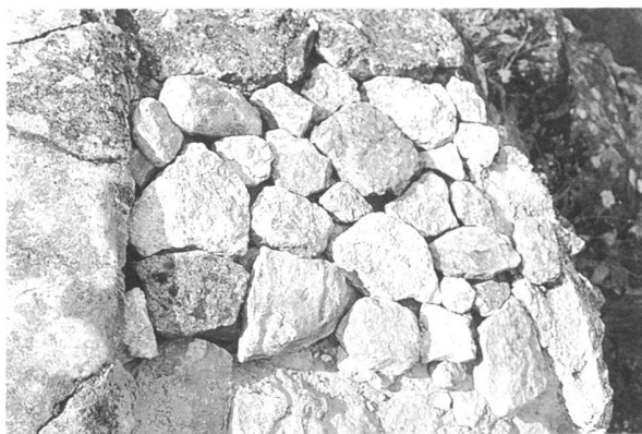
Fig. 6 et 7. Préparation d'une chape de protection. Pour remplacer une chape de ciment fissurée (en haut), on assemble à sec des pierres calcaires qui seront liées au mortier de chaux (en bas). De telles chapes évitent l'usure mécanique du noyau original due au passage des visiteurs et assurent une bonne protection contre les intempéries, pluie, neige ou exposition excessive au rayonnement solaire.