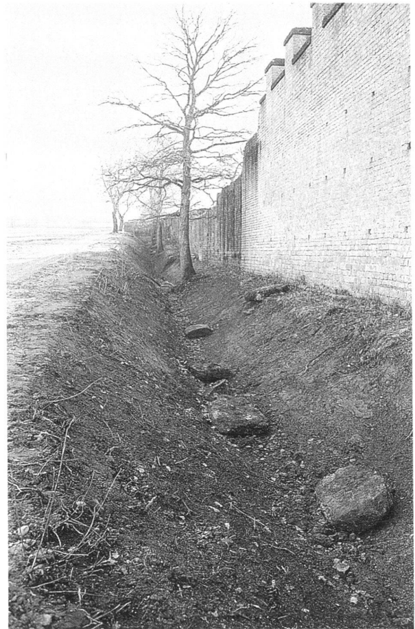
Fig. 8. Le fossé du mur d'enceinte au nord de la porte de l'Est, rétabli dans son profil original. Les chaperons tombés du sommet du mur restent à récupérer.

A l' Amphithéâtre , le 4 e festival d'opéra a rassemblé près de 40'000 spectateurs, du 3 au 22 juillet; au programme, dont la production a été reprise en début d'année par la nouvelle Association Aventicum Opéra , la Turandot de G. Puccini (les 3, 4, 5, 9, 10, 11 et 12 juillet) et le Barbier de Sivilgia de G. Rossini (les 17, 18, 20 et 22 juillet). Après une générale et une première de Turandot écourtées du dernier acte par une météo contraire, toutes les représentations se sont