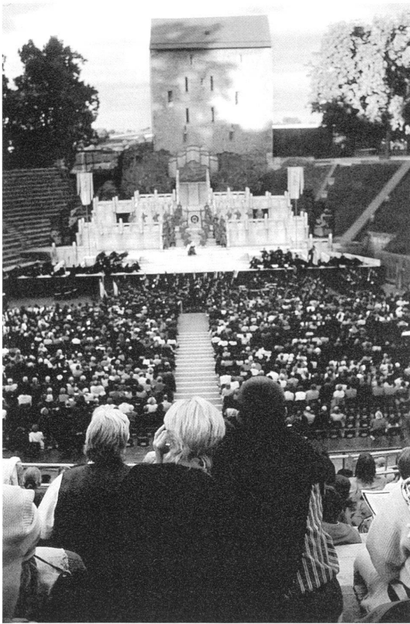
Fig. 9. L'amphithéâtre lors d'une représentation de la Turandot de G. Puccini.

La mise en valeur des monuments d' Aventicum et l'utilisation occasionnelle de certains d'entre eux s'affirment donc chaque année davantage comme des activités importantes pour la réputation du site romain et l'animation touristique et culturelle de la ville d'Avenches.