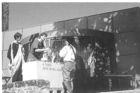
Fig. 7. «Journée internationale des musées», le 18 mai 1998. Sous le thème «A table avec Marc Aurèle», l'équipe du Musée propose un choix de mets et de vins préparés par eux-mêmes.

Le 18 mai 1998, le Musée romain d'Avenches a suivi l'appel de l' ICOM ( International Council of Museums ) d'or-