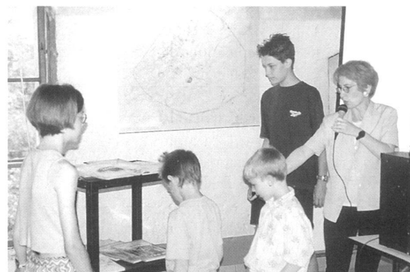
Fig. 8. Remise des prix aux gagnants du concours pour enfants organisé lors de la «Journée internationale des musées», le 18 mai 1998.

Le 17 juin 1998, le Grand Conseil de l'Etat de Vaud a voté un crédit de 3,29 mio de francs pour la réalisation de la mise en valeur et de la couverture des thermes d'époque tibérienne, datables de la troisième décennie du I er s. ap. J.-C. Cette décision du parlement vaudois est un grand pas en avant dans la mise en valeur du site d' Aventicum et témoigne de l'intérêt croissant des autorités pour cet important site historique.