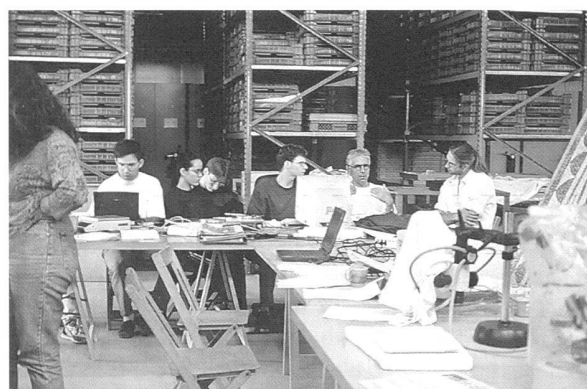
Fig. 11. Fouille de la tombe datable de la période La Tène finale par les étudiants du cours d'archéobiologie de l'Université de Bâle.

Le 5 juin 1998, A. Hochuli-Gysel a présenté, à l'Université de Bâle, une synthèse des connaissances sur Avenches-Aventicum. Cette conférence a marqué le début du cours en archéobiologie donné en collaboration avec les professeurs Stefanie Jacomet et Jörg Schibler du Seminar für Früh- und Urgeschichte de l'Université de Bâle du 22 juin au 10 juillet 1998 (fig. 9-11). Un groupe d'étudiants en archéologie a appris à appliquer diverses méthodes d'étude et d'analyse sur du matériel faunique et botanique provenant du site romain d'Aventicum. Par chance, l'importante découverte d'une tombe à incinération, datable vers 80 av. J.-C., conte-