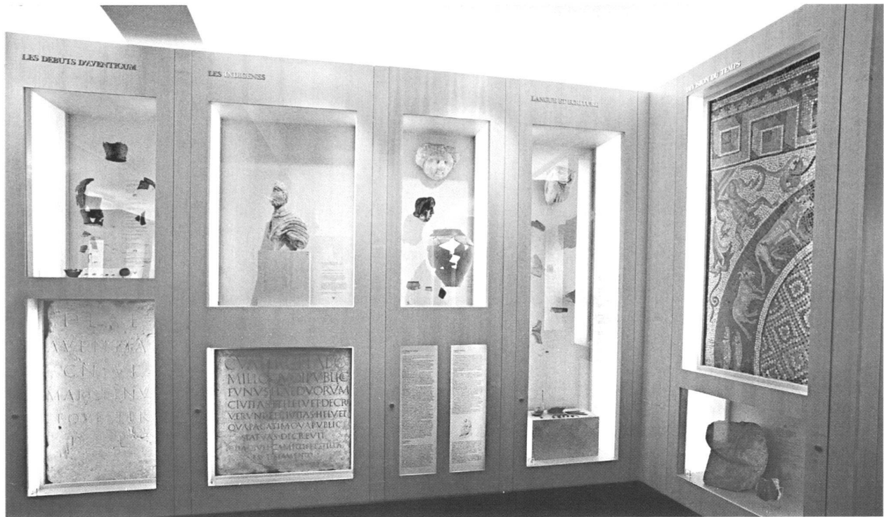
Fig. 4. Vue partielle de la nouvelle collection permanente, au premier étage du Musée romain d'Avenches. Vitrines