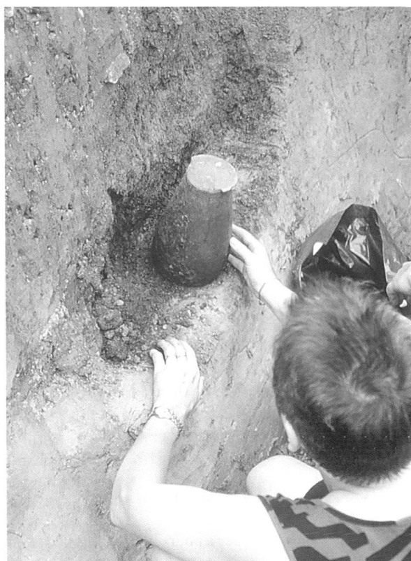
Fig. 10. Dépôt du Site et musée romains d'Avenches. Cours d'archéobiologie de l'Université de Bâle.