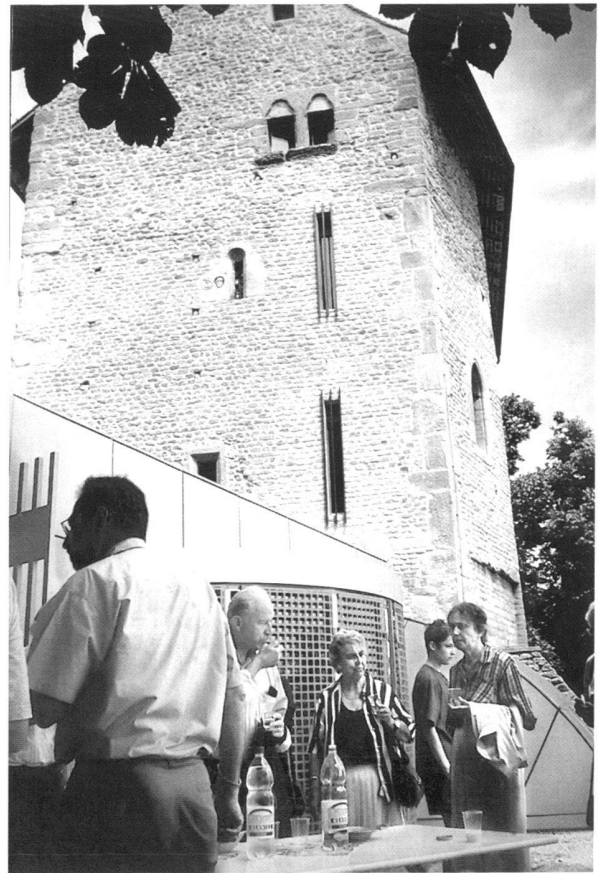
Fig. 6. Grâce à un temps splendide, les auditeurs de l'« Apéritif du Musée » sur le thème des « Bibliothèques et collections à l'époque romaine », se rafraîchissent sur la terrasse du musée (6.6.1998).