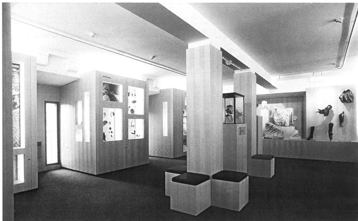
Fig. 3. Vue partielle de la nouvelle collection permanente, au premier étage du Musée romain d'Avenches.

La vitrine intitulée «L'Antiquité tardive» est aussi nouvelle (fig. 5). Les éléments d'architecture, les céramiques, les monnaies et les autres objets exposés témoignent de la continuation de l'occupation du site d' Aventicum au IV e voire aux V e /VI e siècles ap. J.-C. Cette période est mieux connue depuis les fouilles effectuées en 1997 à l'est du théâtre romain ( BPA 39, 1997, p. 207-209). La nouvelle exposition permanente témoigne aussi de la bonne collaboration entre musées: pour la première fois, une mosaïque d'Avenches emportée au XVIII e siècle par les Bernois et conservée au Bernisches Historisches Museum est déposée au Musée romain d'Avenches en prêt à long terme (fig. 4).