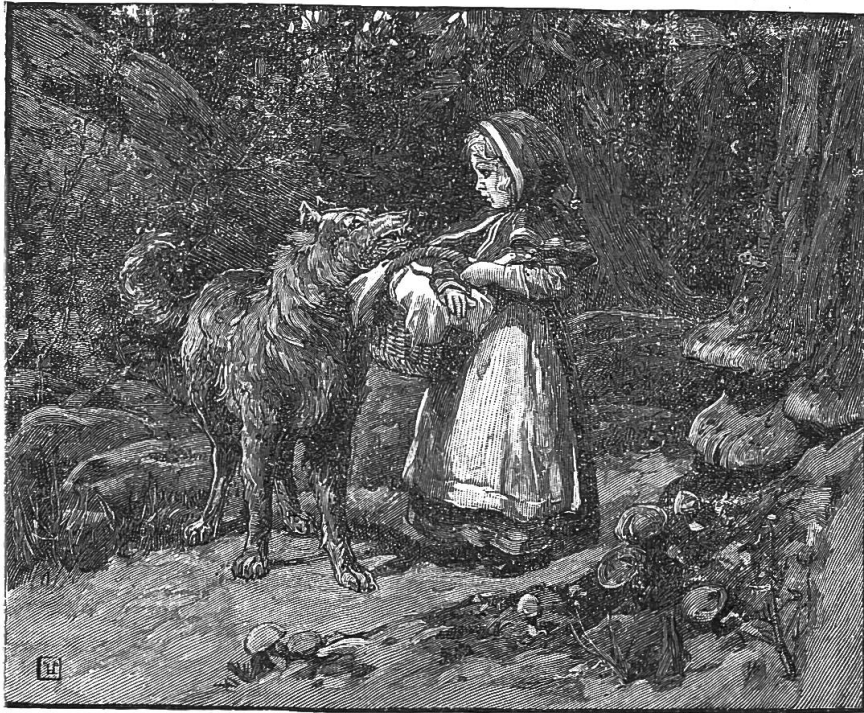
"I am glad to see you, Sir Wolf."

15. "I am glad to see you, Sir Wolf," said the child. "But I must not stop to talk."