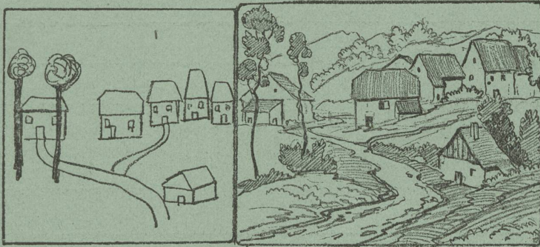
Fig. 267. — Dessin d'élève.