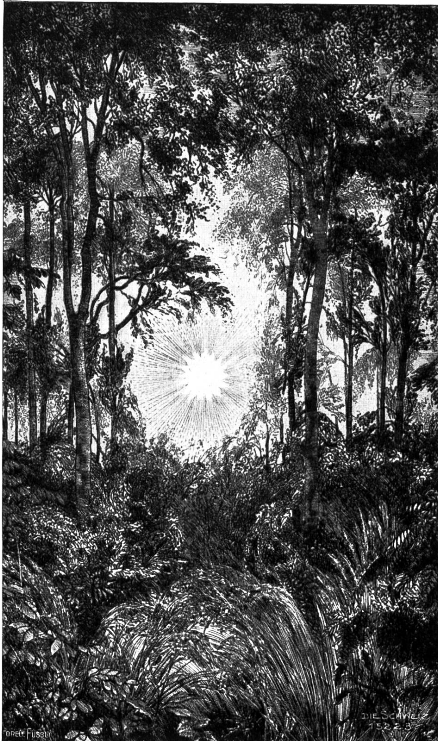
Abendsonne im Wald. (Radierung von E. Anner.)