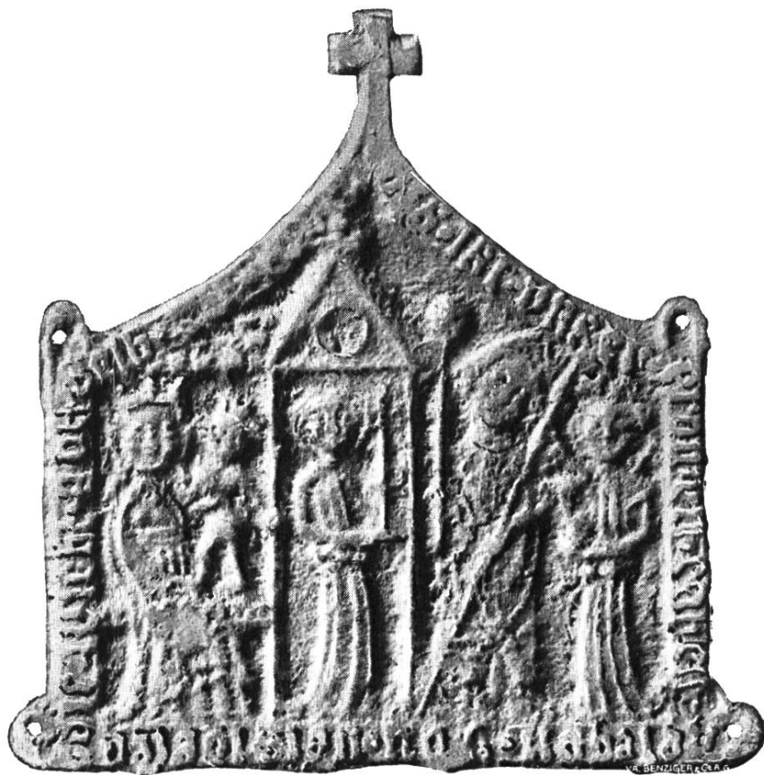
Ältestes Pilgerzeichen von Einsiedeln auf einer Glocke zu Schinznach vom Jahre 1429.