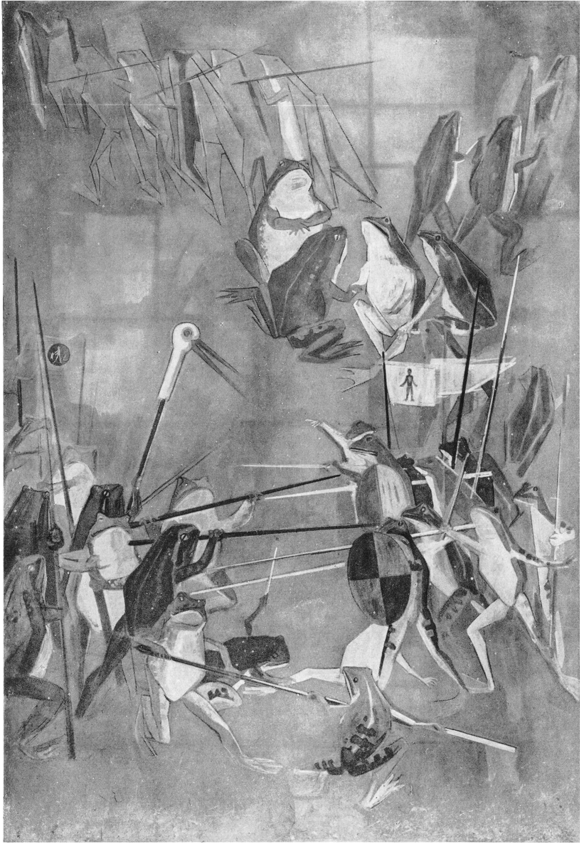
Otto Kälin, Der Fröschen- und Krötenkrieg, Schulhaus Wohlenschwil