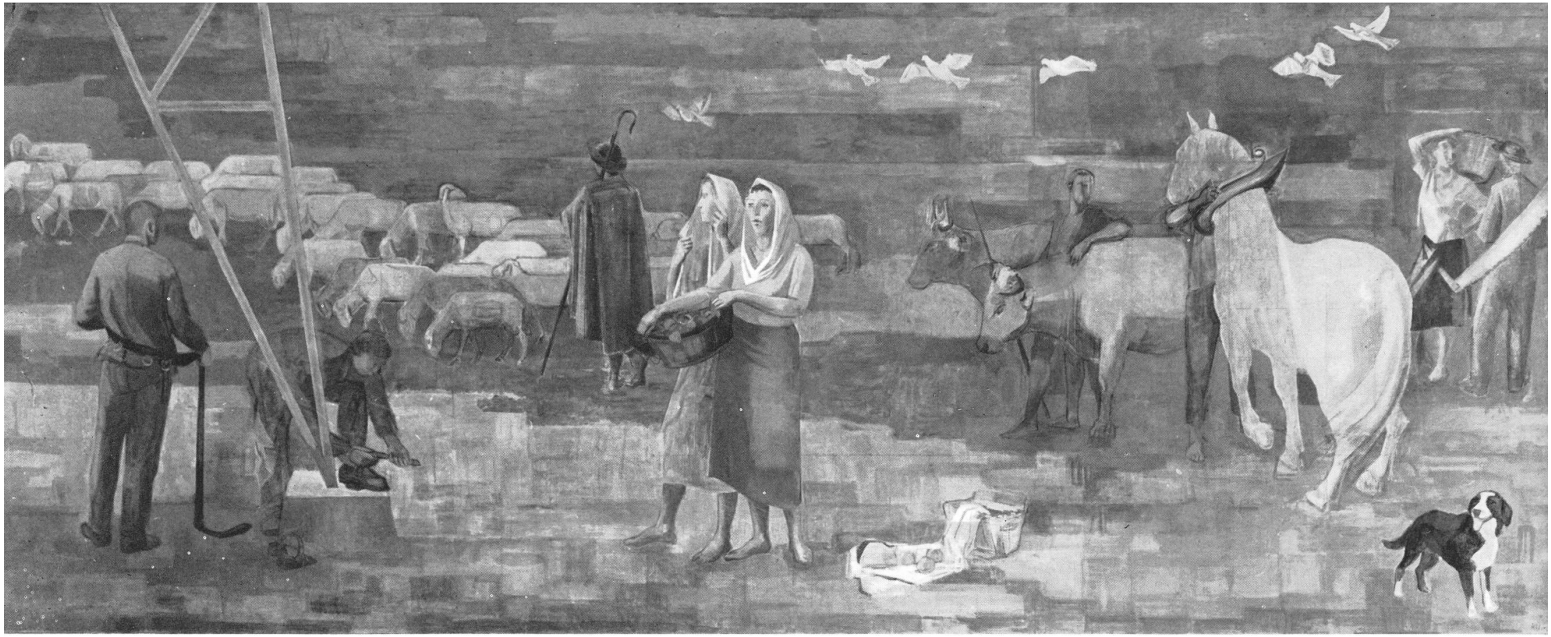
Otto Kälin, Wandbild, Gewerbeschule Baden, Eingangshalle