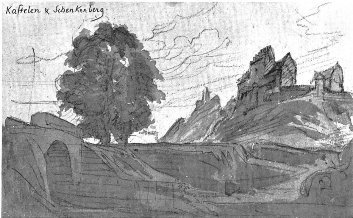
Schloß Kasteln und Ruine Schenkenberg

Zeichnung Scheffels (Scheffel-Archiv Karlsruhe)