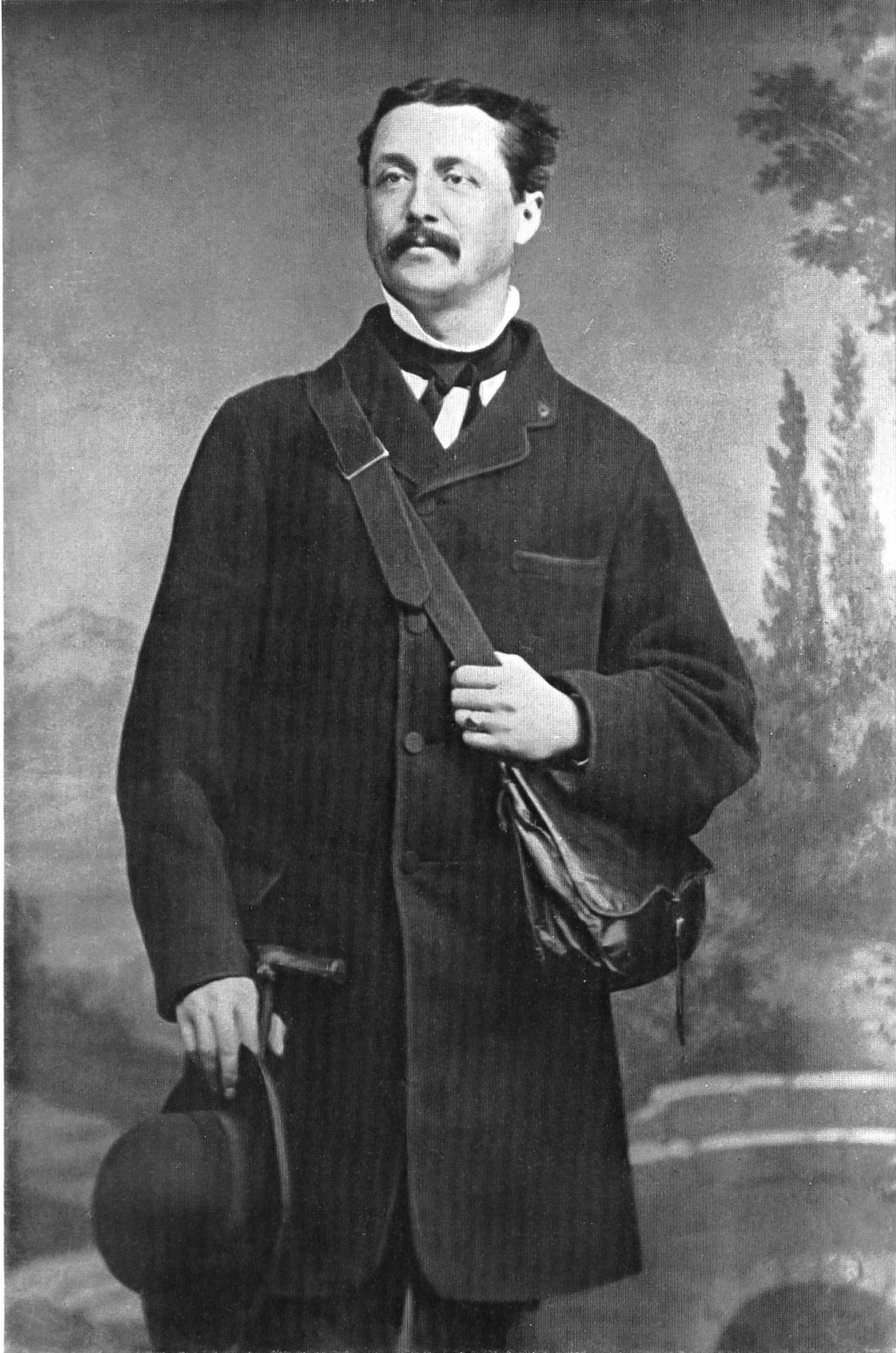
Joseph Viktor Scheffel im Jahre 1864