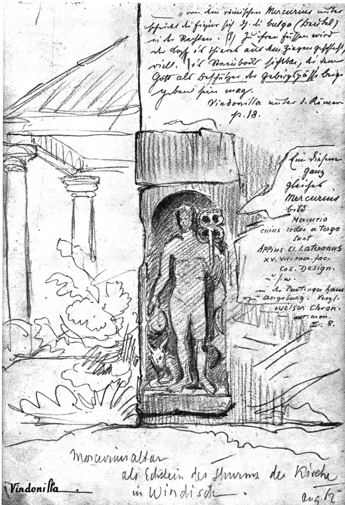
Votivstein für Merkur und die kapitolinische Trias