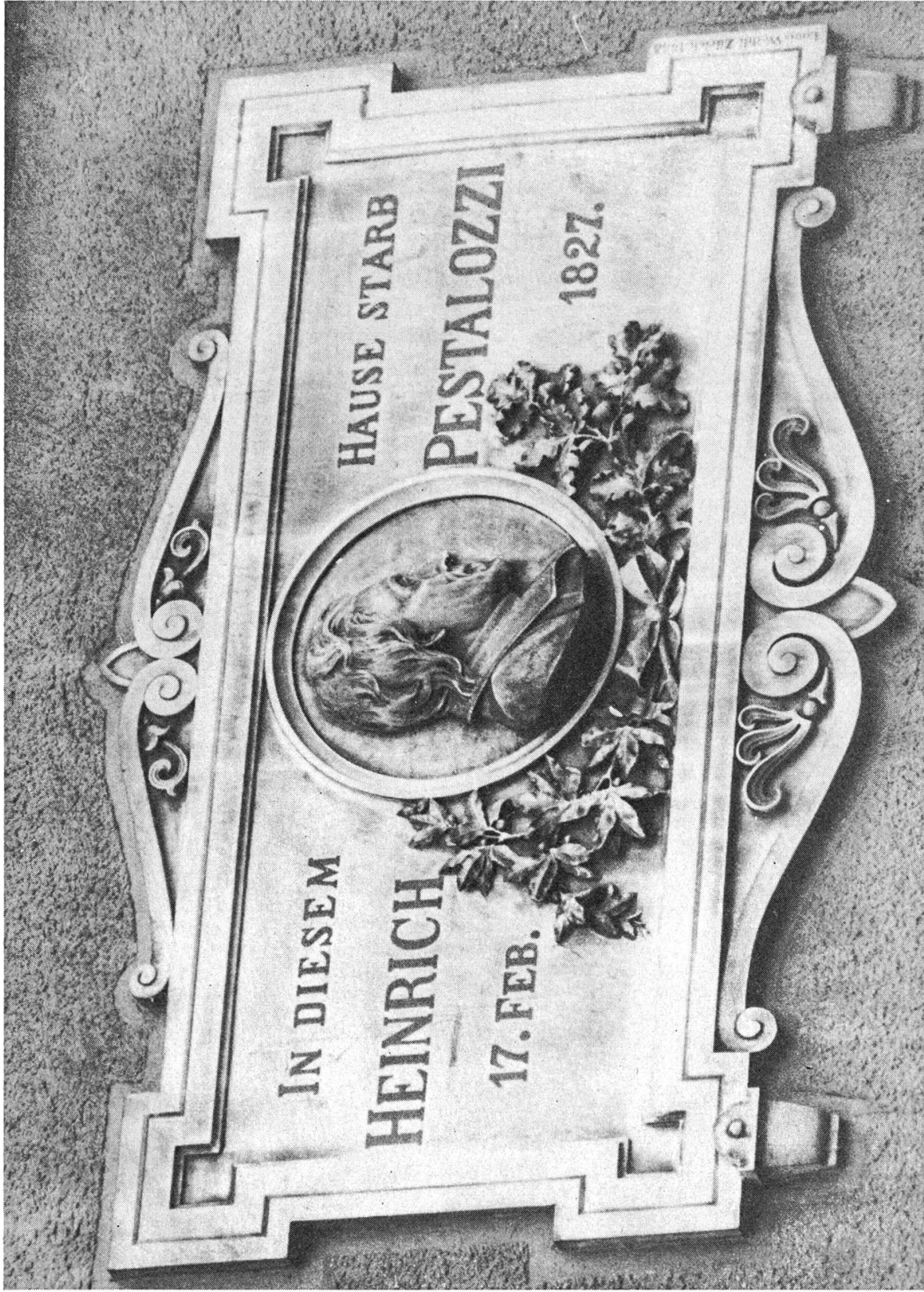
Gedenktafel am Sterbehaus an der Hauptstrasse in Brugg, von Louis Wethli