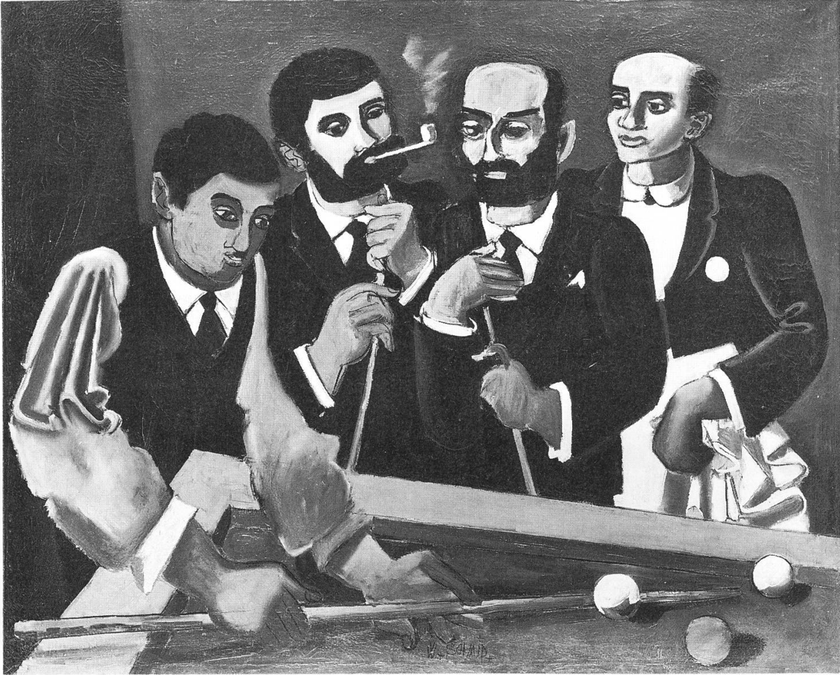
Billardspieler , nach 1935. Kunsthaus Aarau.