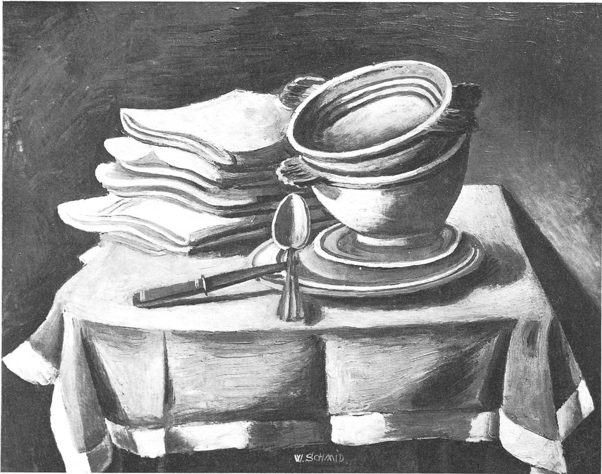
Stilleben mit Servietten , um 1930. Verschollen.