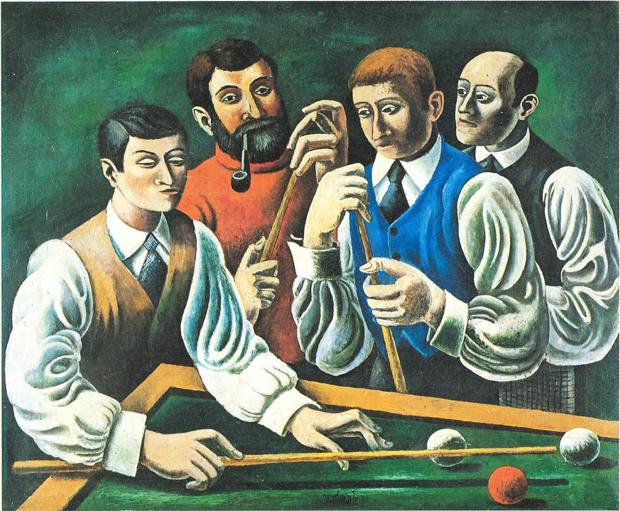
Billardspieler , 1930. Museo W. Schmid, Brè.