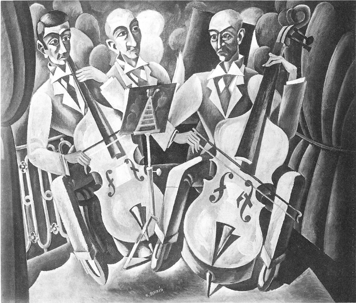
Gelbe Musikanten , 1919. Privatbesitz.