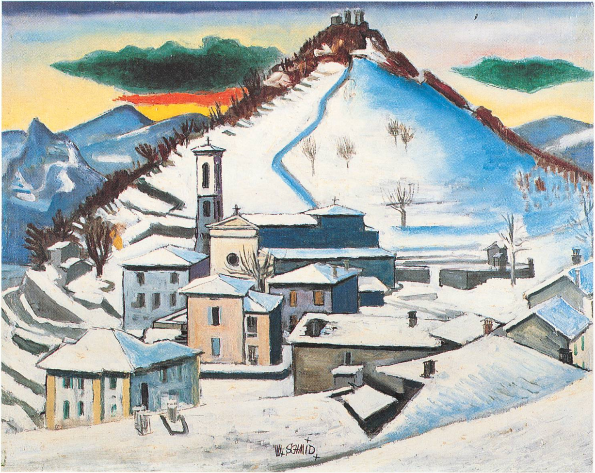
Brè, Winterlandschaft. Museo W. Schmid, Brè.