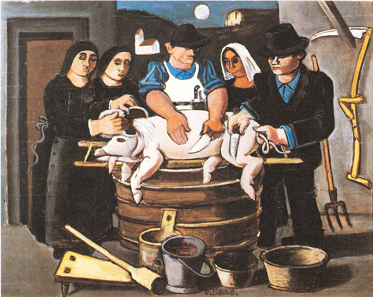
Aargauer Metzgete , um 1940–45. Kunsthaus Aarau.