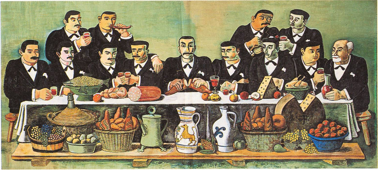
Heliand , 1946. Eigentum der Eidgenossenschaft.