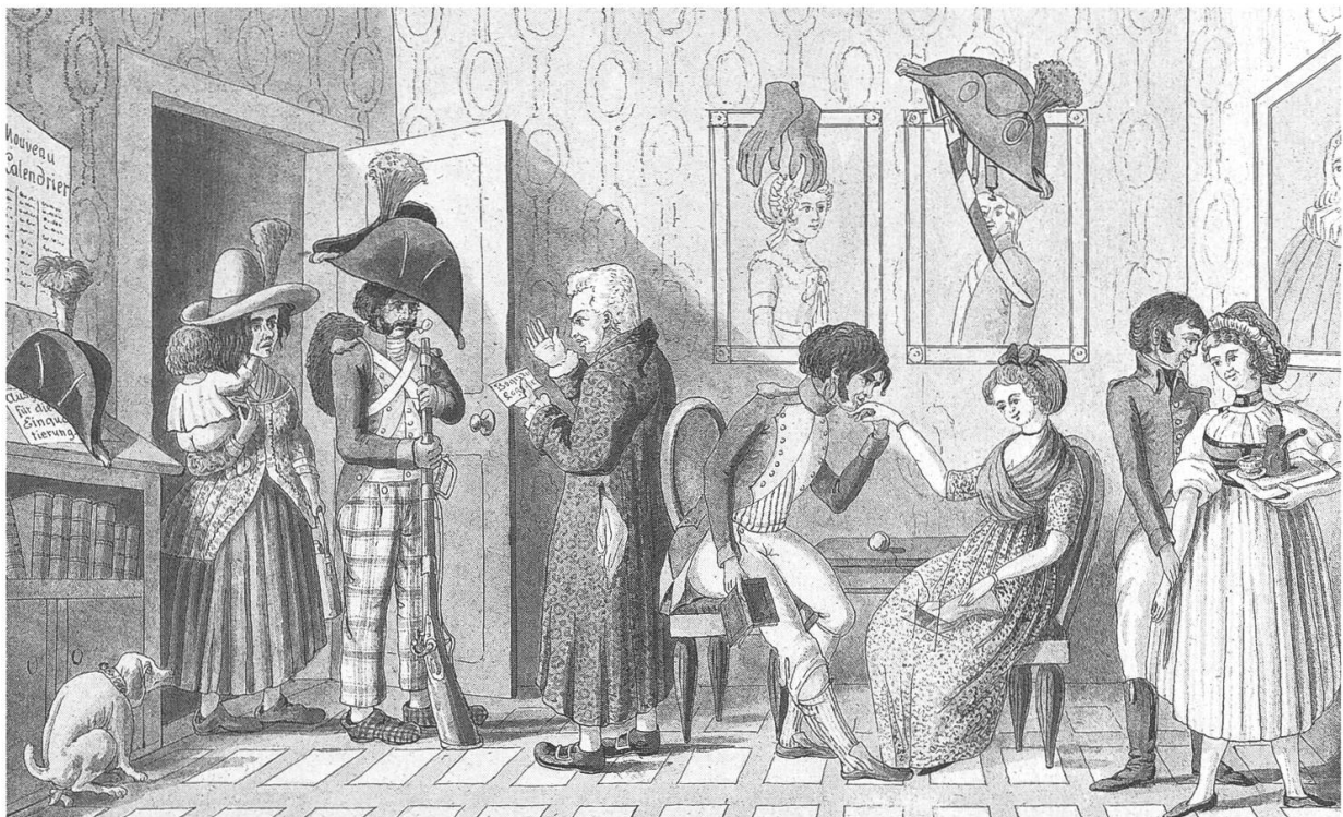
Einquartierte französische Soldaten machen helvetischen Töchtern den Hof.

diese Probleme kümmern. Dies geschah – wie unter der Herrschaft Berns – durch eine Meldepflicht der Schwangeren, durch behördliche Befragungen vor der Geburt sowie durch ein Verhör «in den Schmerzen der Geburt», was für die Frauen besonders demütigend war.